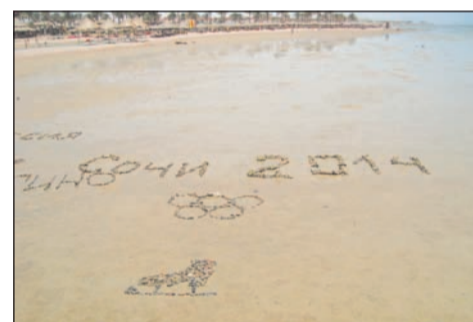
Морское творчество россиян