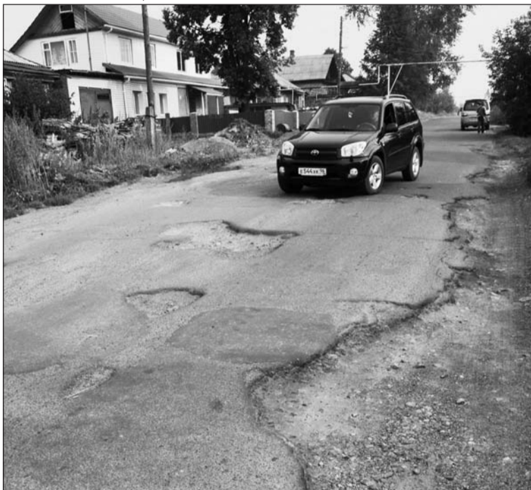
По такой дороге в Верхней Салде хлор возят. Улица Красноармейская

Непроезжие проезжие части города начнут ремонтировать в конце августа. И это уже поздно!