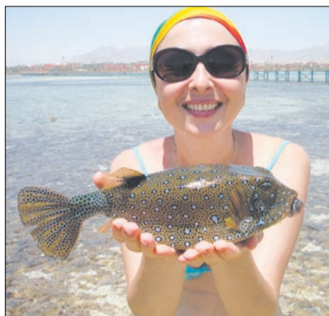
Экзотические рыбы людей не боятся