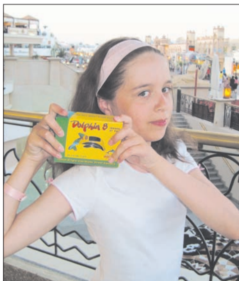
Фотоаппарат для съёмки подводной жизни