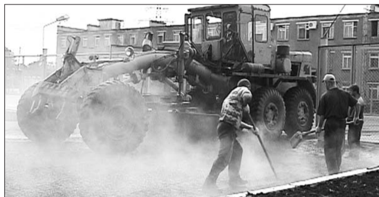
Благоустроительные работы на таможне в разгаре

службы видна невооружённым глазом – никто никому не мешает, несмотря на обилие техники и людей. Одни раскidyвают лопатами асфальт, следом идёт каток, другие разравнивают торф, не путаясь при этом под колёсами грузовика, его выгружающего... Одним сло-