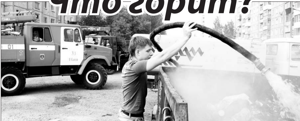
Мусорный контейнер по Районной, 11 горел с часу ночи до 10 утра. К тушению привлекались два пожарных расчёта и поливальная машина УЖКХ.

Задымлённость воздуха в минувшие выходные вызвала много вопросов у горожан.