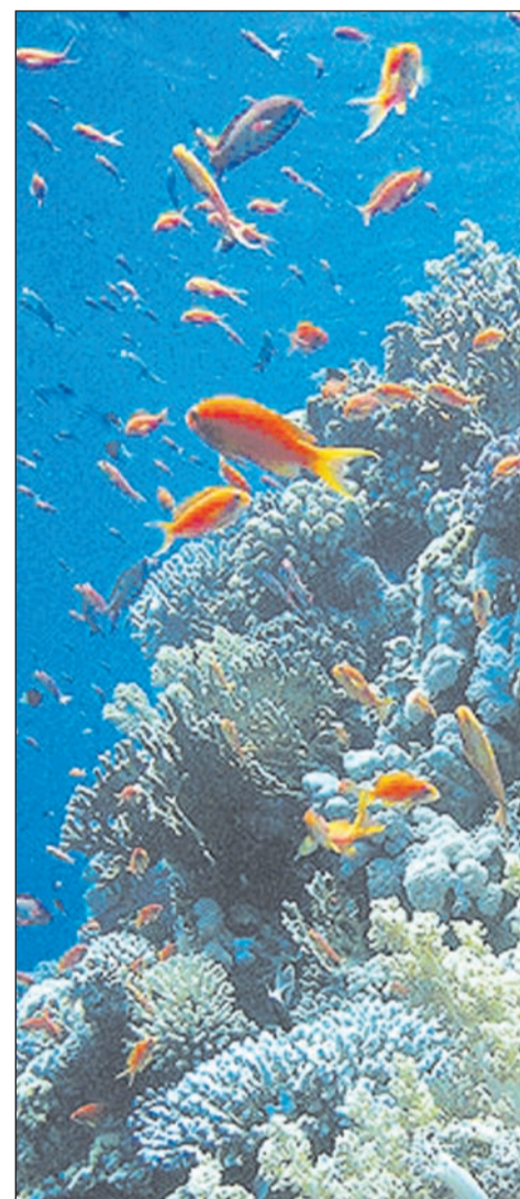
Все краски Красного моря