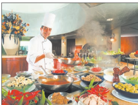
Каждый день – новая кухня