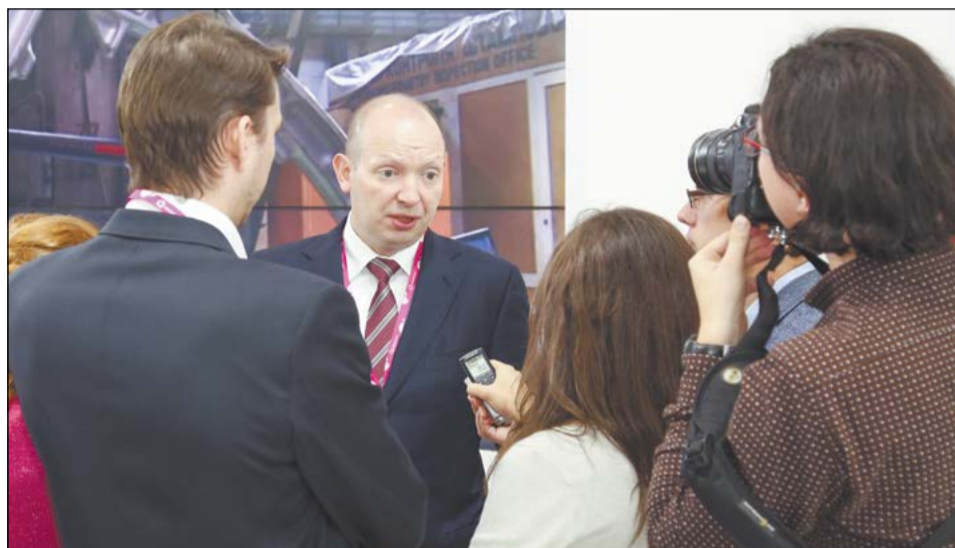
Генеральный директор Корпорации ВСМПО-АВИСМА не испытывает дефицита внимания мировой прессы

– С точки зрения механообработки, мы её по-прежнему развиваем. К 2020 году мы планируем увеличить в два раза наши механообрабатывающие мощности. Частично для этого заканчивается строительство нового корпуса механообработки в «Титановой долине», в котором будут размещены и потенциальные совместные пред-