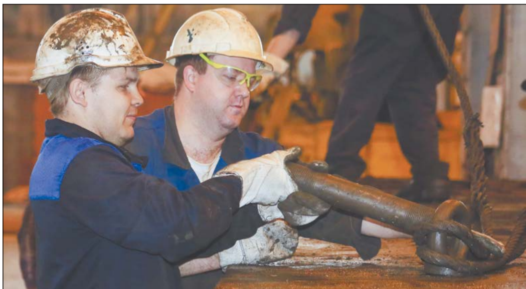
Слесари-ремонтники цеха № 37 профессионально обслуживают и ремонтируют прессы