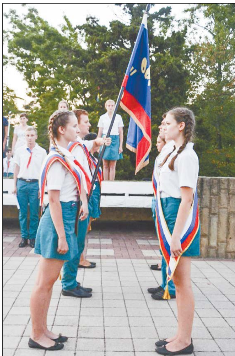
Традиции торжественных линеек живы