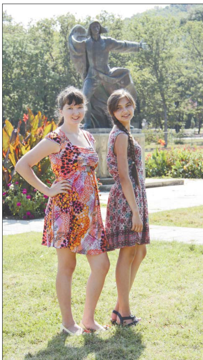
Две салдинские Настя теперь орлята