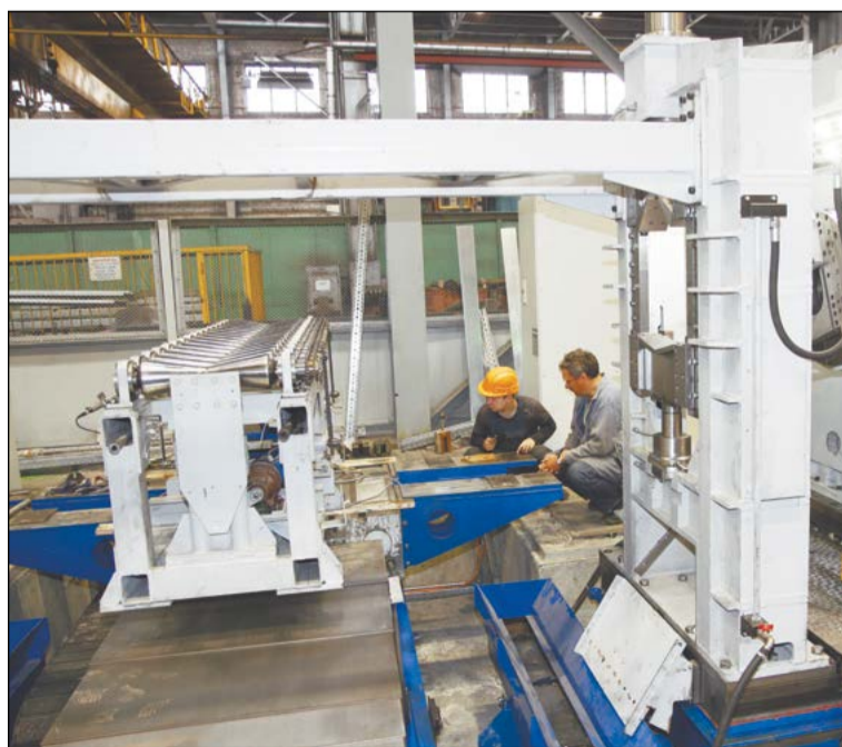
Для нового станка фаски – не проблема