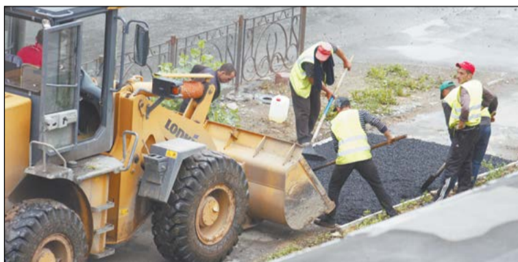
Благоустройство по улице Парковой продолжается

дарил за восстановленный асфальт возле дома: