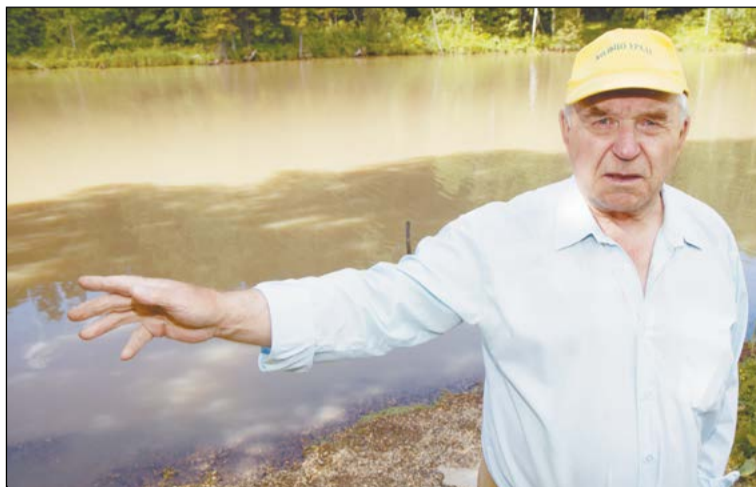
Вода в пруду сада № 10, действительно, стала мутно-жёлтой