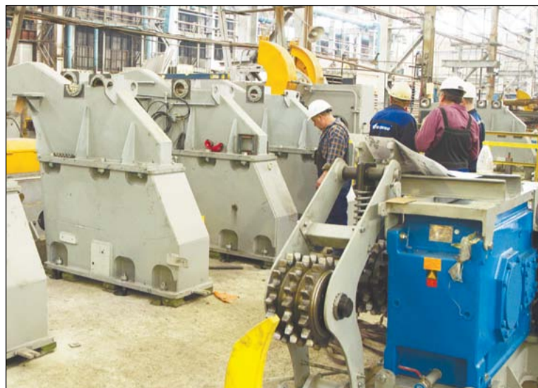
Шеф-монтаж бесцентрово-токарного станка СИ 380 в самом разгаре

На участке мехобработки прутков цеха № 22 ВСМПО идёт монтаж нового станка, изготовленного по заказу Корпорации совместными усилиями итальянской фирмы, белорусского завода и словацкого предприятия. Производственники ВСМПО с нетерпением ждут запуска в эксплуатацию этой единицы оборудования.