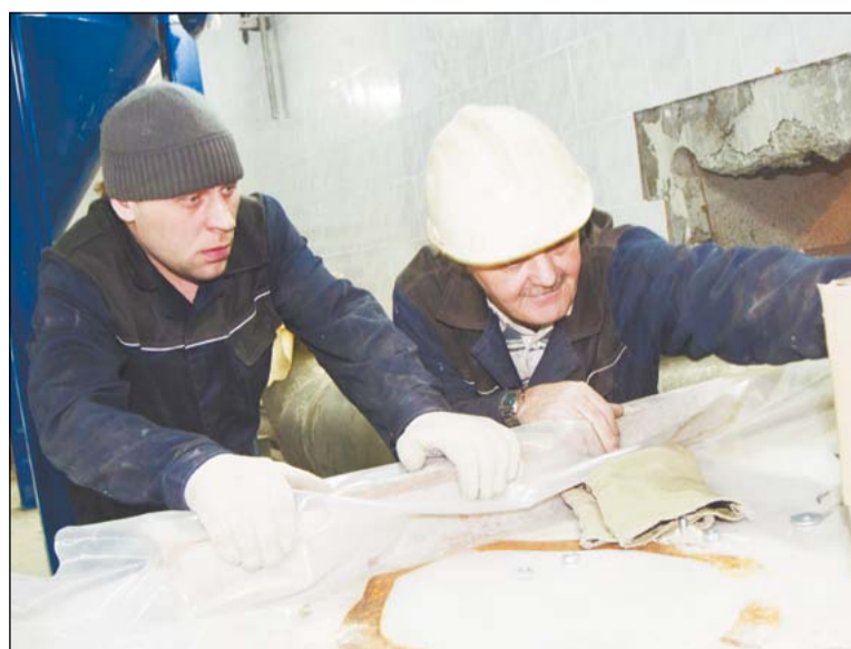
Монтажники распаковывают очередную партию деталей