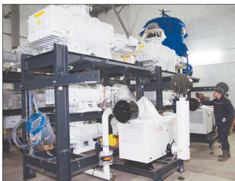
Многоярусная стойка с вакуумными насосами для новых гарнисажек