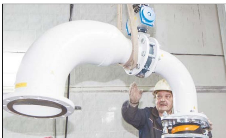
При транспортировке всех составляющих системы нужно особое внимание