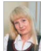
Рубрику ведёт Олеся САБИТОВА телефон 6-22-14