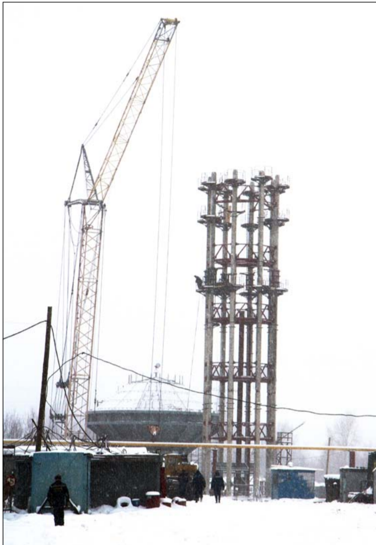
Общая высота столба водонапорной башни гарнисажных печей составит 48 метров

В новогодние каникулы все необходимые операции были успешно проведены и обе печи