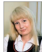
Рубрику ведёт Олеся САБИТОВА телефон 6-22-14