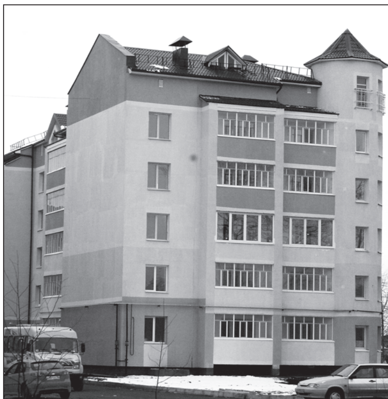
С 2003 года ВСМПО строит жильё для своих работников