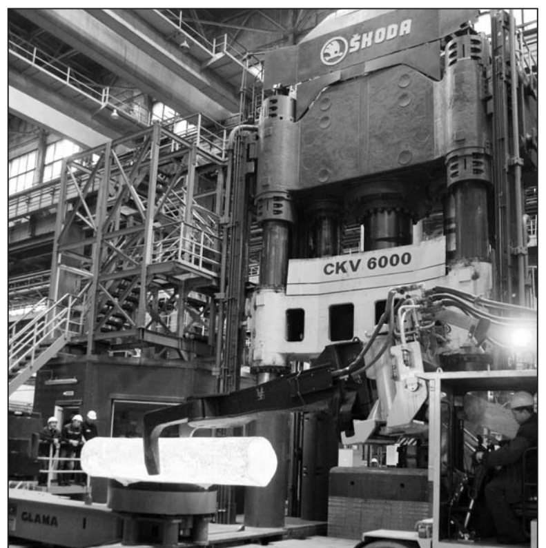
Первые удары прессы 306 в цехе № 37