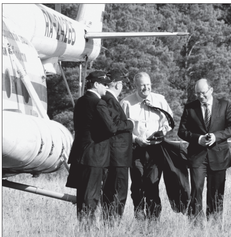
«Впечатляет!» – подвёл итог визиту в Корпорацию ВСМПО-АВИСМА вице-президент компании Boeing Джим Албай