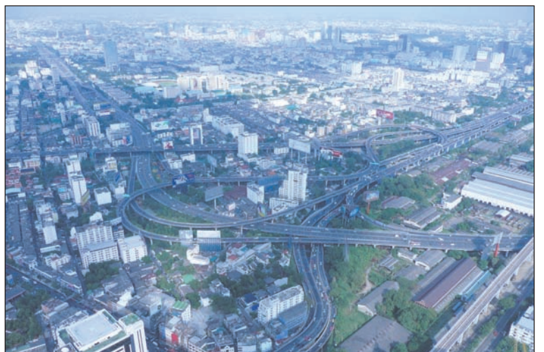
Вид на Бангкок с высоты 83-го этажа