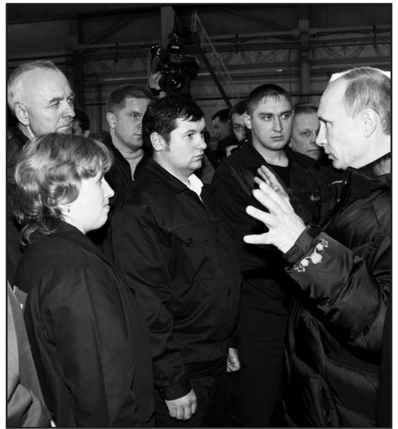
Премьер-министр в нашем городе впервые, но много о Салде знает