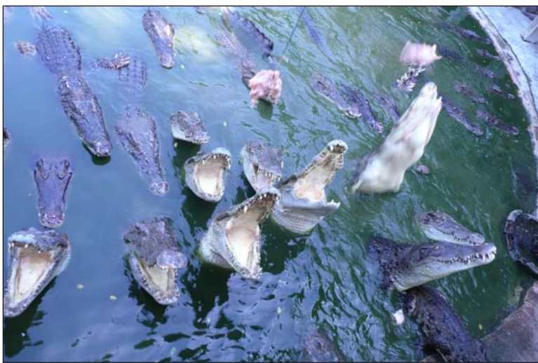
Крокодилы приготовились к кормёжке