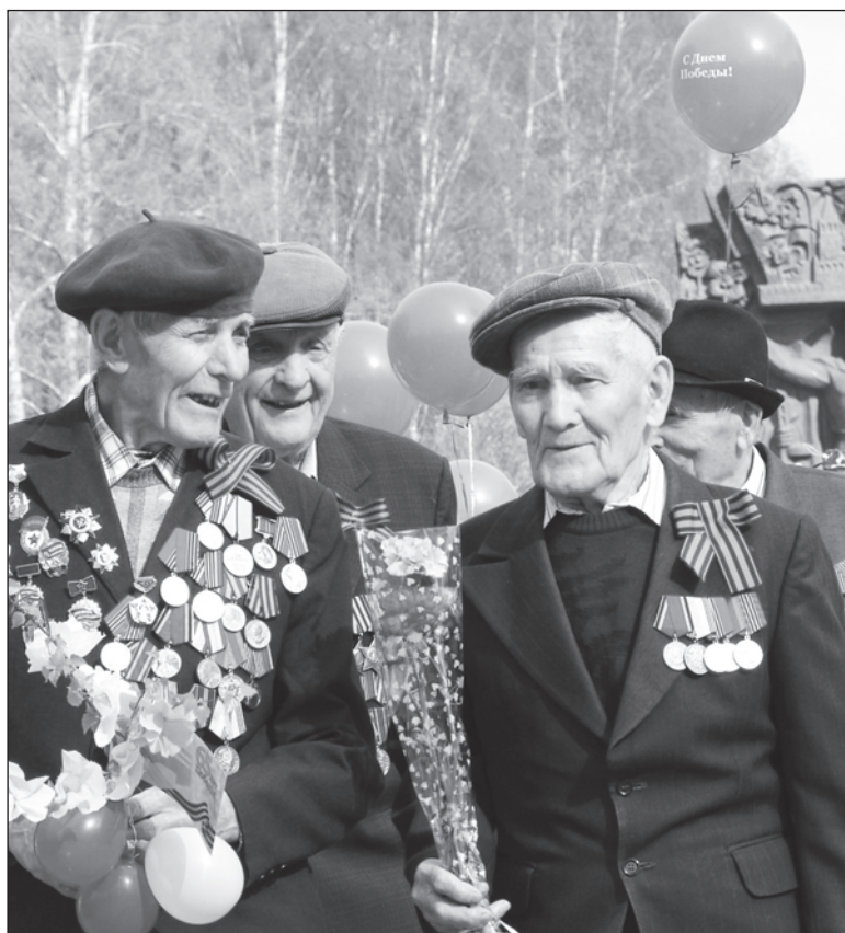
И будет май всегда Победным!