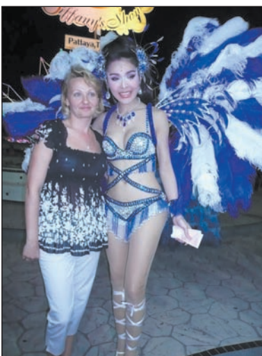
Фото с леди-бой

ВАЛЮТА. На территории Таиланда все расчёты осуществляются в местной валюте – тайских батах. Курс бата к американскому доллару – приблизительно 29,5 бата за 1 доллар США. 1 рубль равен 0,8 бата. 1 Евро – 39 батам.