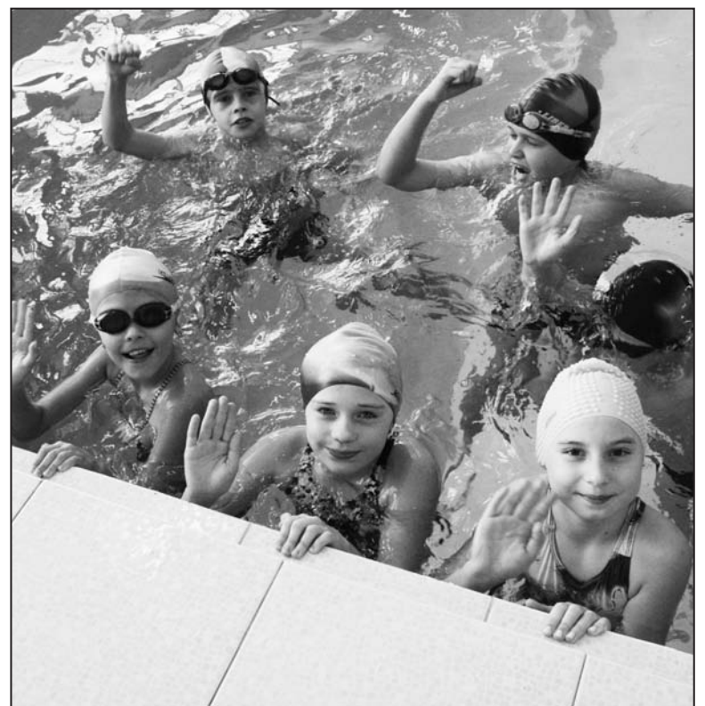
«Крепыш» – для крепышей