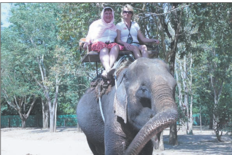
Побывать в Таиланде и не покатасться на слоне?!