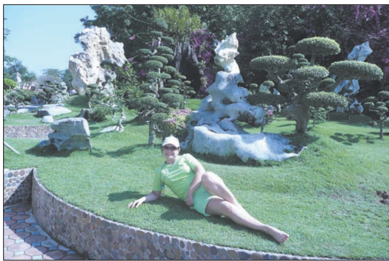
В парке миллионолетних камней

Паттайя – молодой город, основанный в середине 60-х годов прошлого столетия. Сюда во время вьетнамской войны приезжали на отдых для разрядки американские солдаты (Таиланд входил в число союзников США). С того времени и начала развиваться в Паттайе секс-индустрия. 20 лет отдыхали здесь американцы, а 15 лет назад здесь появились русские. Теперь в городе сплошь и рядом слышна родная речь. Магазин кожаных изделий «Вован», закусовая «От Захаров-