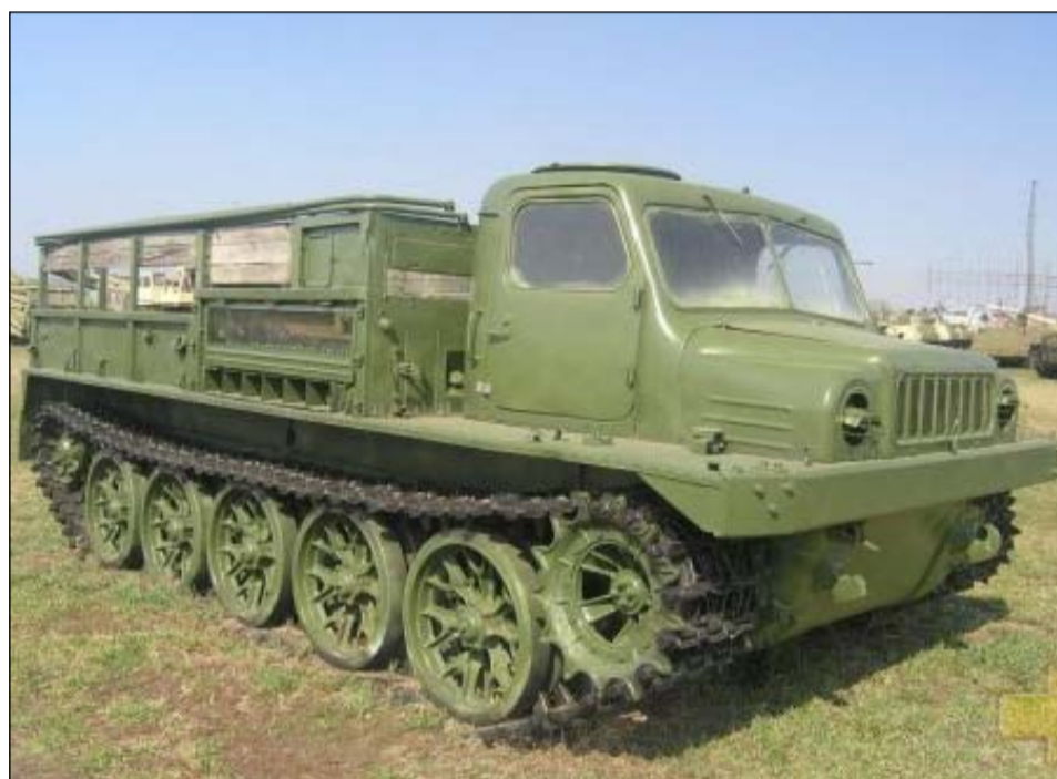
Средний артиллерийский тягач АТС – первая военная продукция КМ

Удачный контракт на поставку БМП-3 в Объединённые Арабские Эмираты, заключённый в 1991 году, спас завод от тяжёлого кризиса, позволил сохранить научно-технический потенциал. Благодаря поступлению средств от продажи спецтехники, началось освоение новых наукоемких изделий – лесопромышленной машины МЛ-107 и гусеничного вездехода ТМ-120.