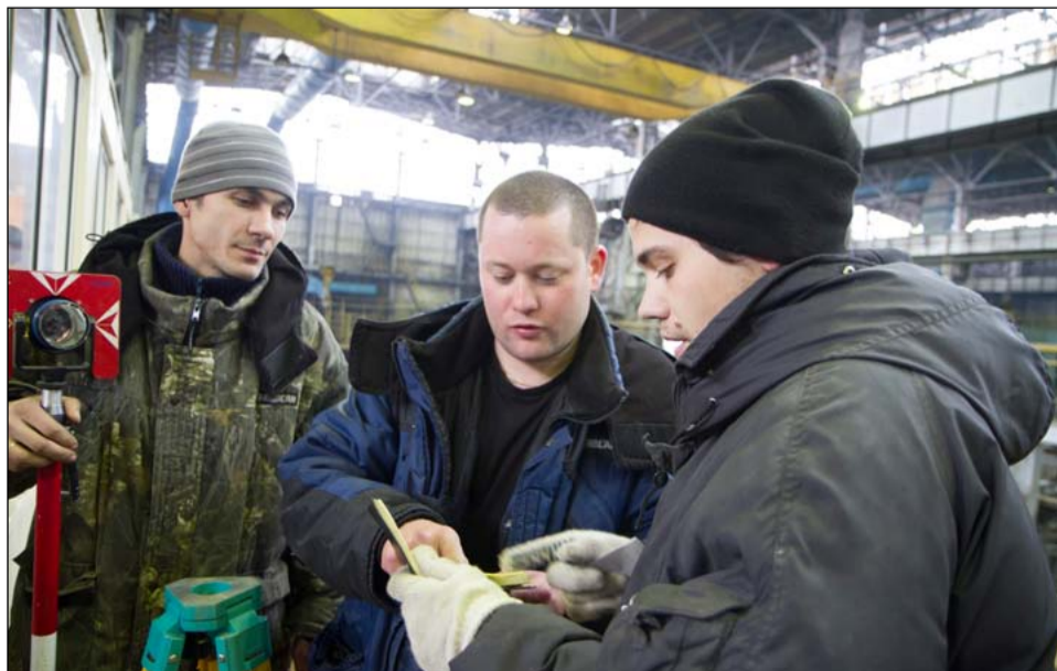
Геодезисты УКСа и цеха № 65 всё вымеряют до сотых миллиметра