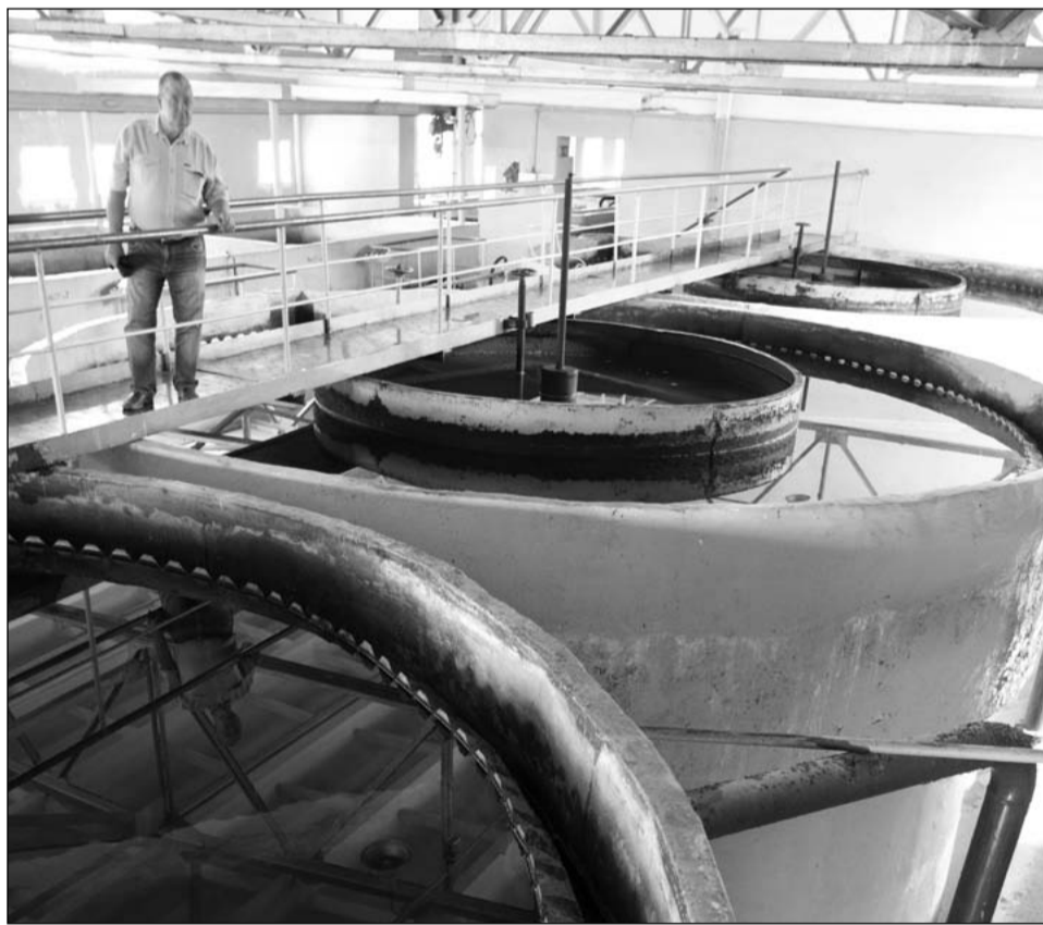
Осветлители первой очереди фильтровального зала

Но и они уже загружены работой под завязку. Поэтому в инвестиционной