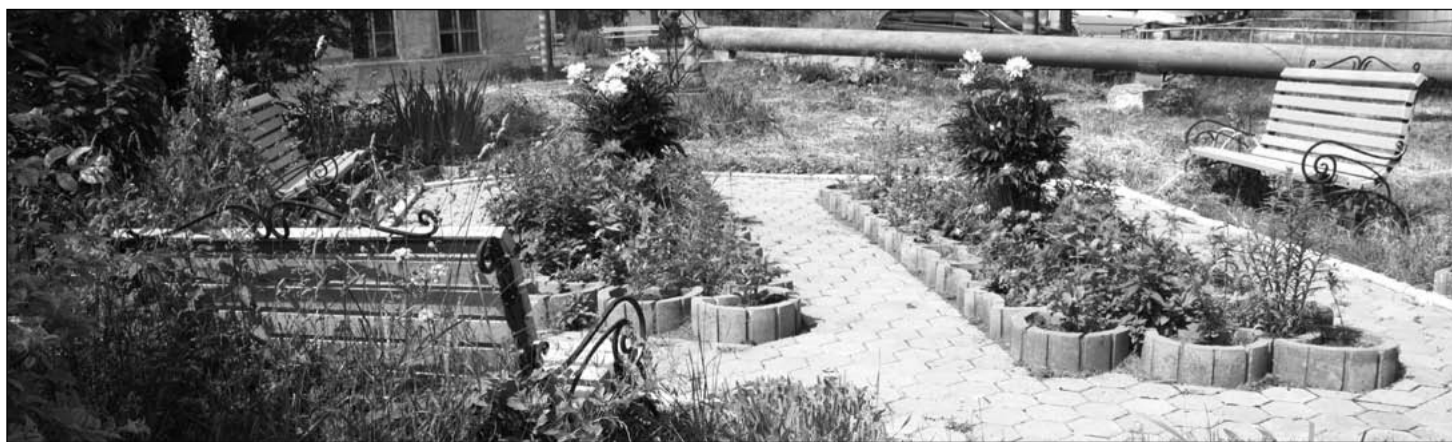
Территория образцового содержания