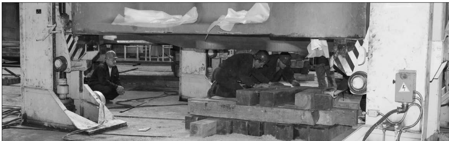
На домкратах груз оставлять нерационально, они востребованы и должны работать дальше. Чтобы их освободить, под груз укладывают шпальную клеть