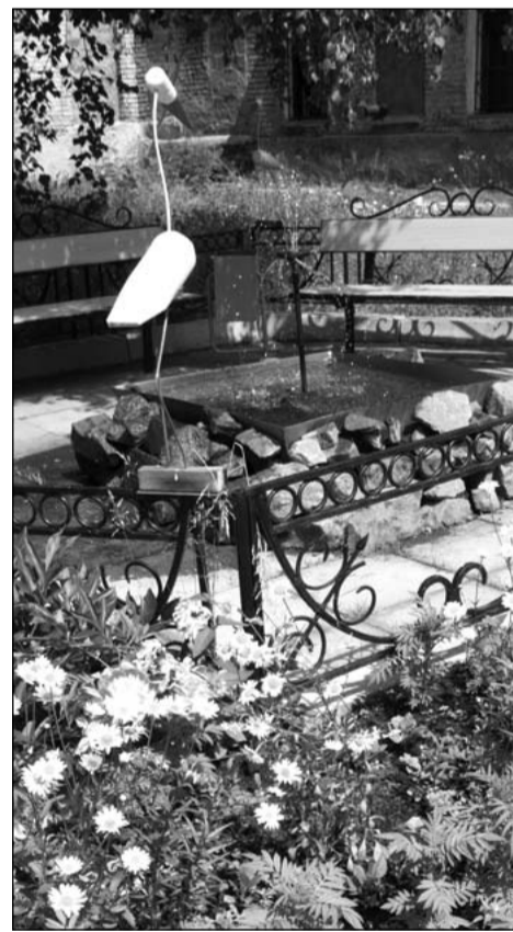
Настоящая зона отдыха