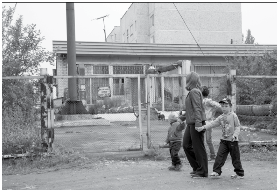
Котельная на Вертолётном всё ещё не работает, но надежда умирает последней

остановление исполнителем предоставления коммунальной услуги, которое может привести к нарушению прав на получение коммунальной услуги надлежащего качества потребителем, полностью выполняющим обязательства, установленные законодательством Российской Федерации и договором, содержащим положения о предоставлении коммунальных услуг, НЕ ДОПУСКАЕТСЯ».