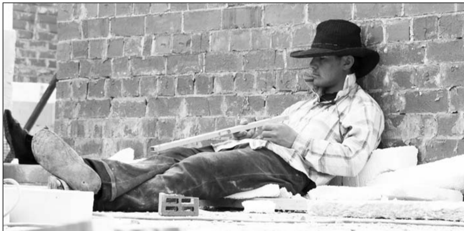
В обеденный перерыв удобнее в стильной шляпе, чем в строительной каске

Слои облицовочного кирпича и наружных стен соединены между собой, как говорят строители, гибкими связями. Кладочная сетка создаёт более прочную конструкцию. Для рабочих