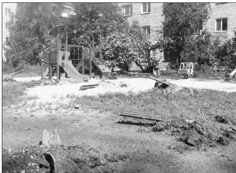
Старые металлические столбы заменяют на волейбольную площадку

Территория за городским рынком несколько лет назад была облагорожена силами предпринимателей города. В этом году деревянные фигур-