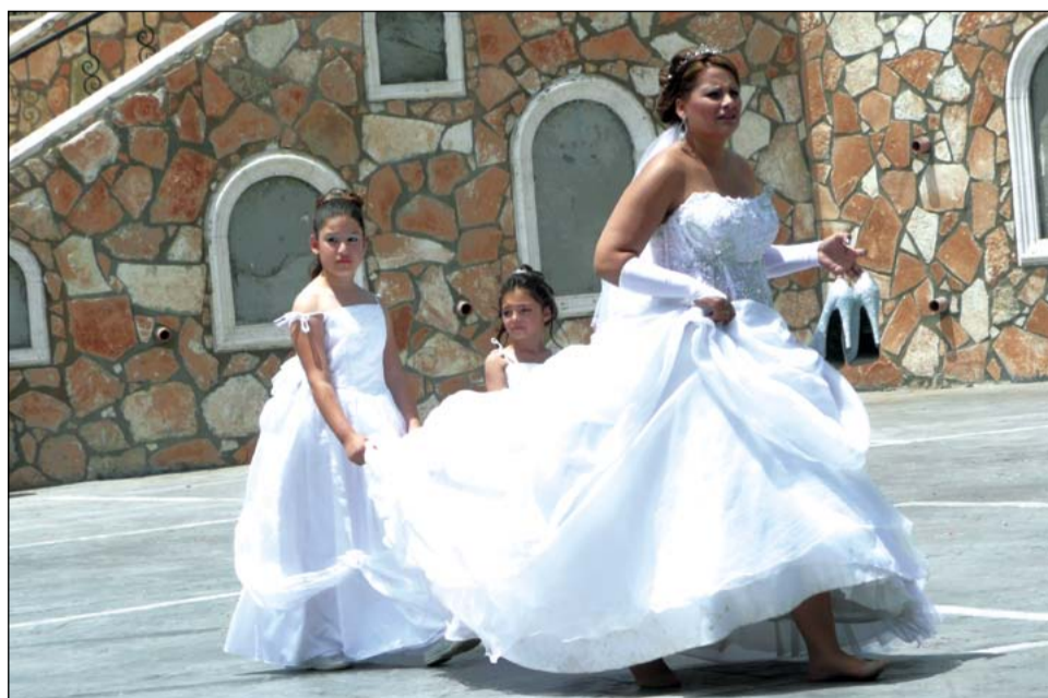
Свадьба на Кипре собирает более 1000 человек. Все стараются поддержать молодых и дарят деньги: кто сколько может, но не меньше 50 евро (верхней границы нет)