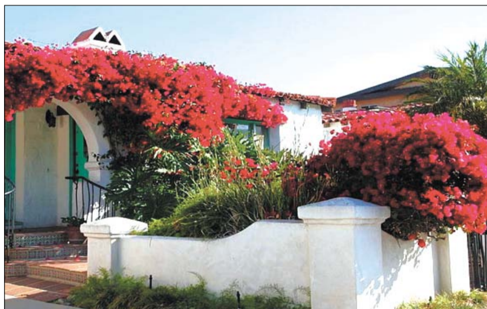
Вьющаяся бугенвиллея поражает своим величием! Яркие цветы украшают дома и часто выступают в роли изгороди