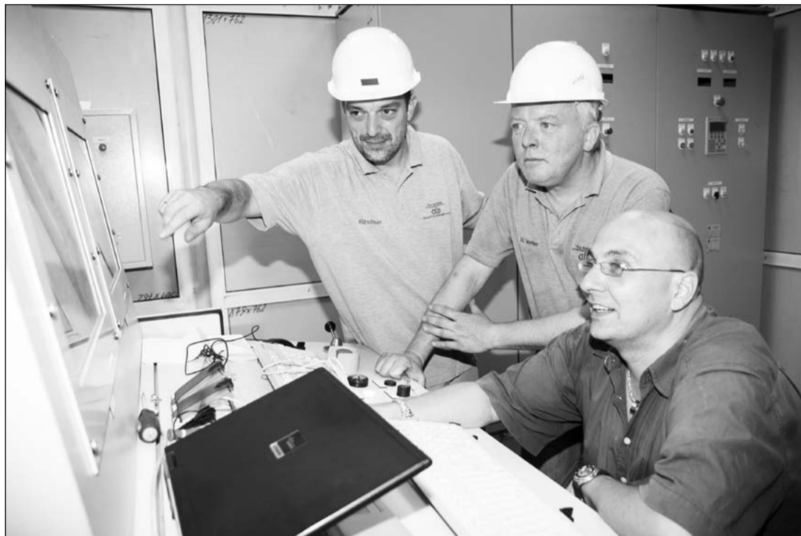
Сервис-инженеры фирмы ALD гарантируют точную работу всех систем немецкой печи

– В данный момент уже опробована гидросистема. Приведены в движение некоторые элементы конструкции. Сегодня происходит опрессовка систем