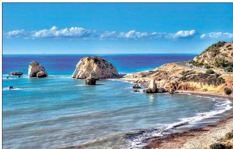
Скала Афродиты. По преданию, чтобы стать красивой, вокруг неё нужно проплыть три раза