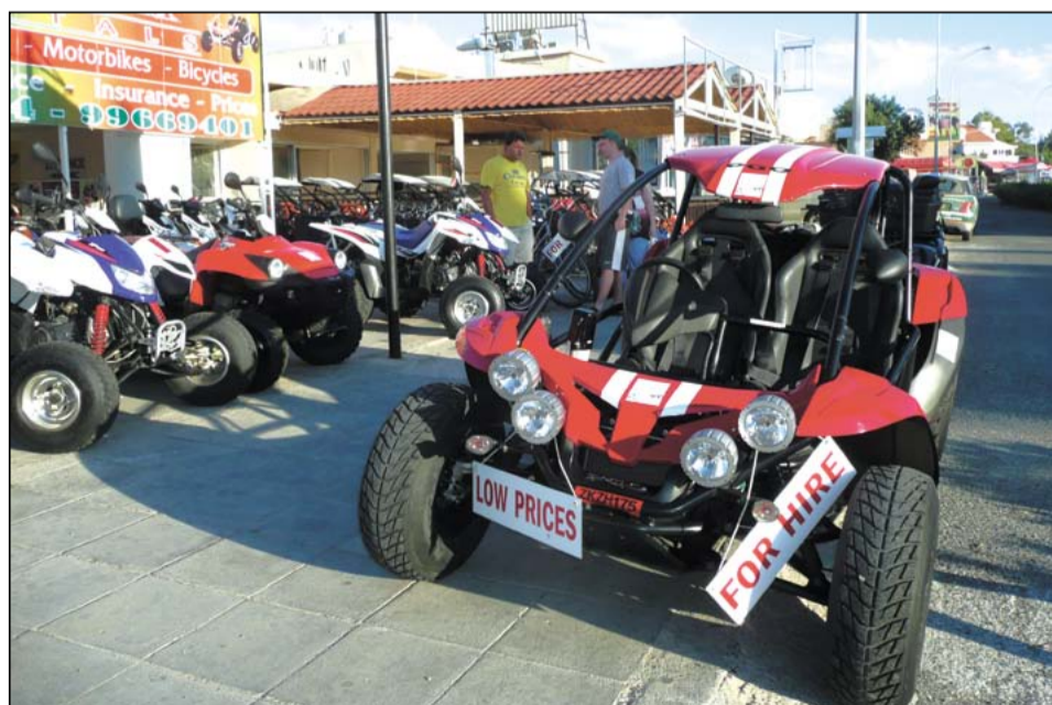
Прокат машин – 60 евро в сутки, квадроцикла – 40, велосипеда – 8 евро. Учитывая, что цена на бензин 52 рубля за литр, велосипед – самое выгодное средство передвижения