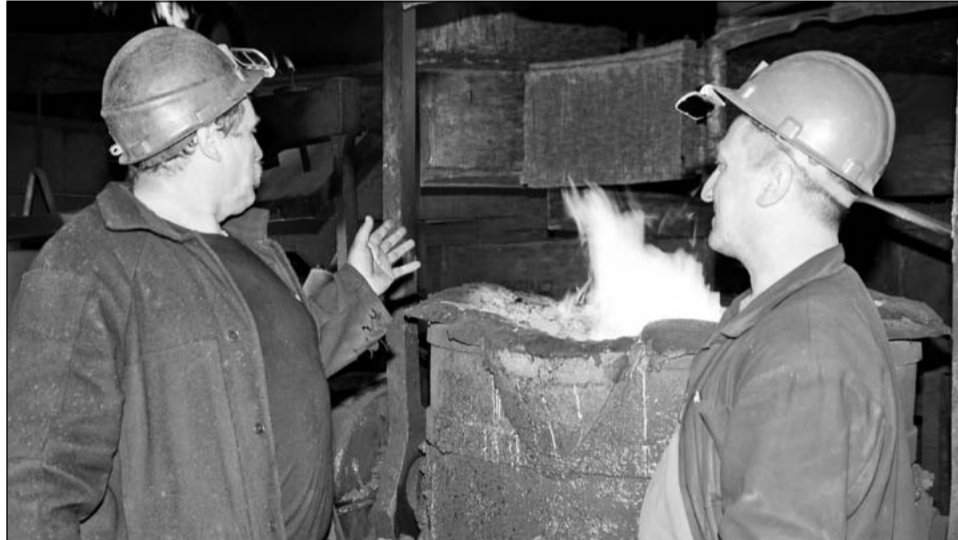
Последние всполохи в печах «Руслича». Конец 2011-го года.

Тогда было возбуждено уголовное дело, состоящее из 488 эпизодов пре-