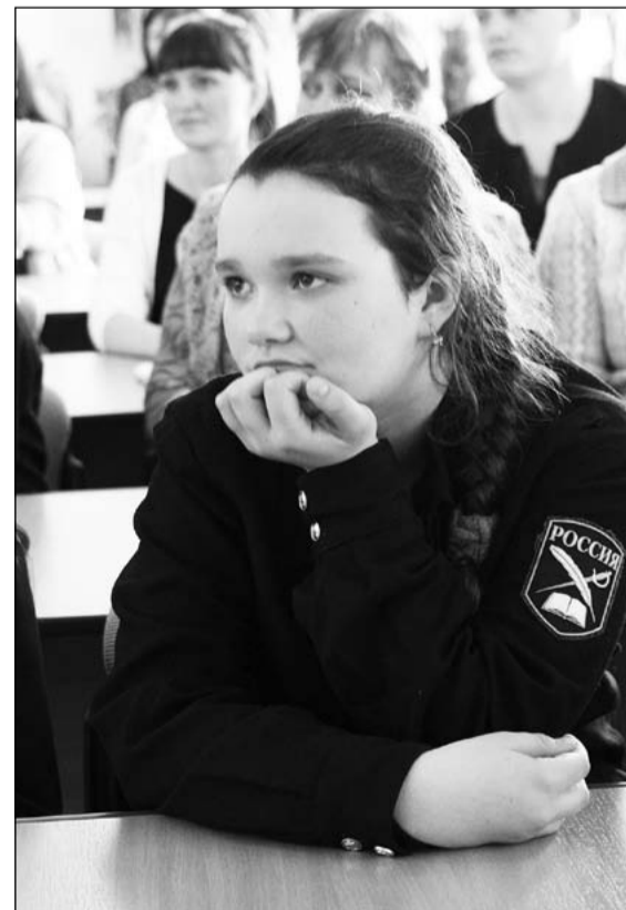
«Какие люди, какие времена!»