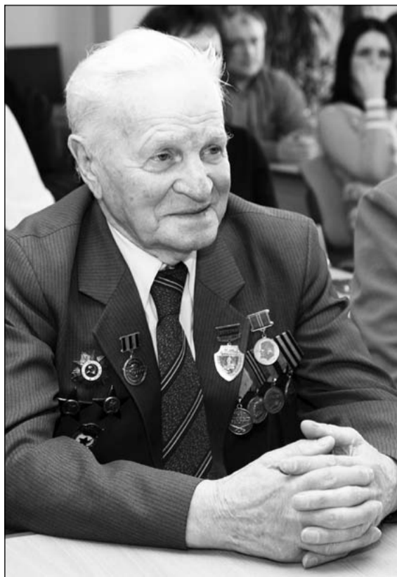
Григорий Рыбаков – герой на века

Во исполнение последней воли, Герой Советского Союза похоронен на территории братского захоронения на Пионерской площади в селе Погорелое Городище Зубцовского района.