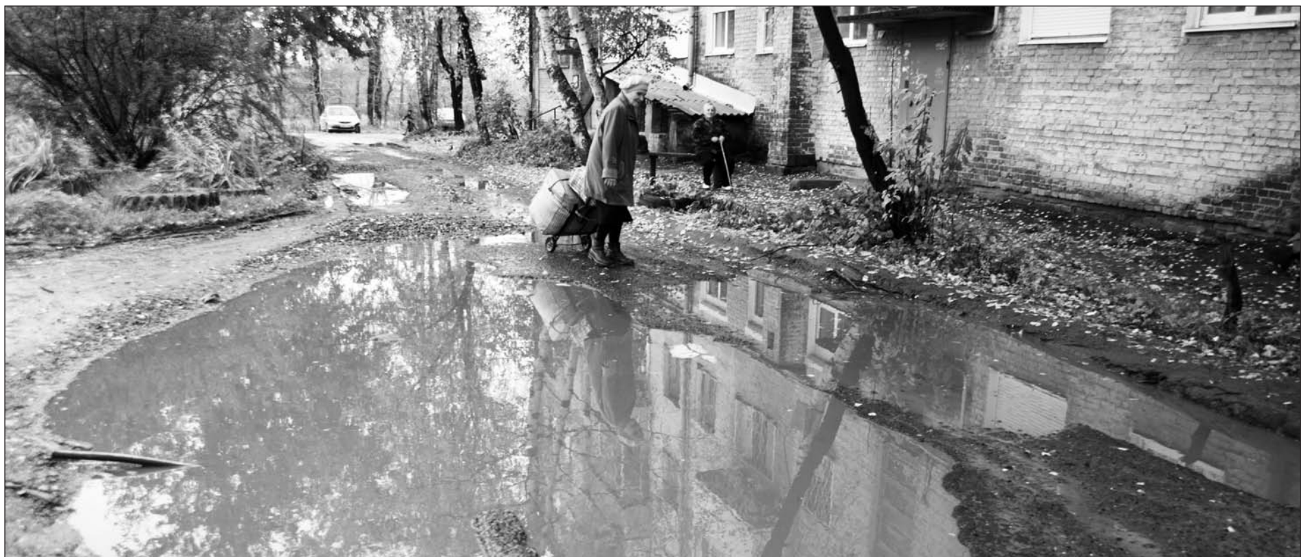
Сентябрь 2012 года. Верхняя Салда, улица Карла Маркса, дом № 9