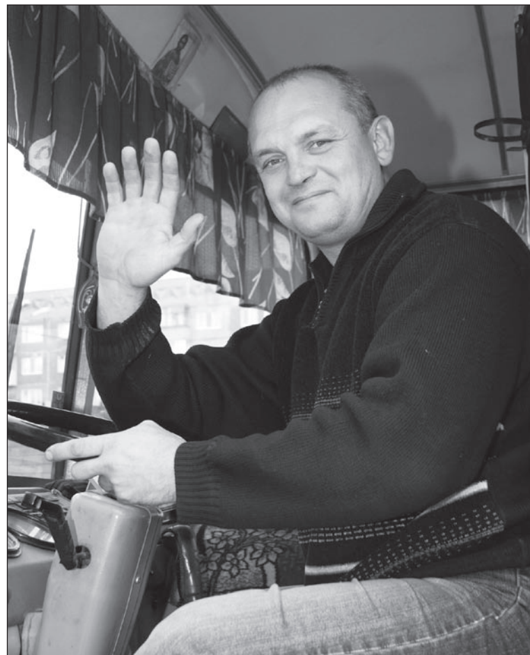
У руля – Путин

– Вы не знаете, что такое комары, у нас, в Пермском крае, они, как динозавры, летают. И