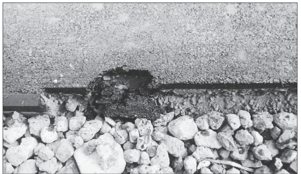
Тротуар по Карла Маркса протяжённостью 757,5 метра обошёлся салдинским налогоплательщикам в 800 тысяч рублей