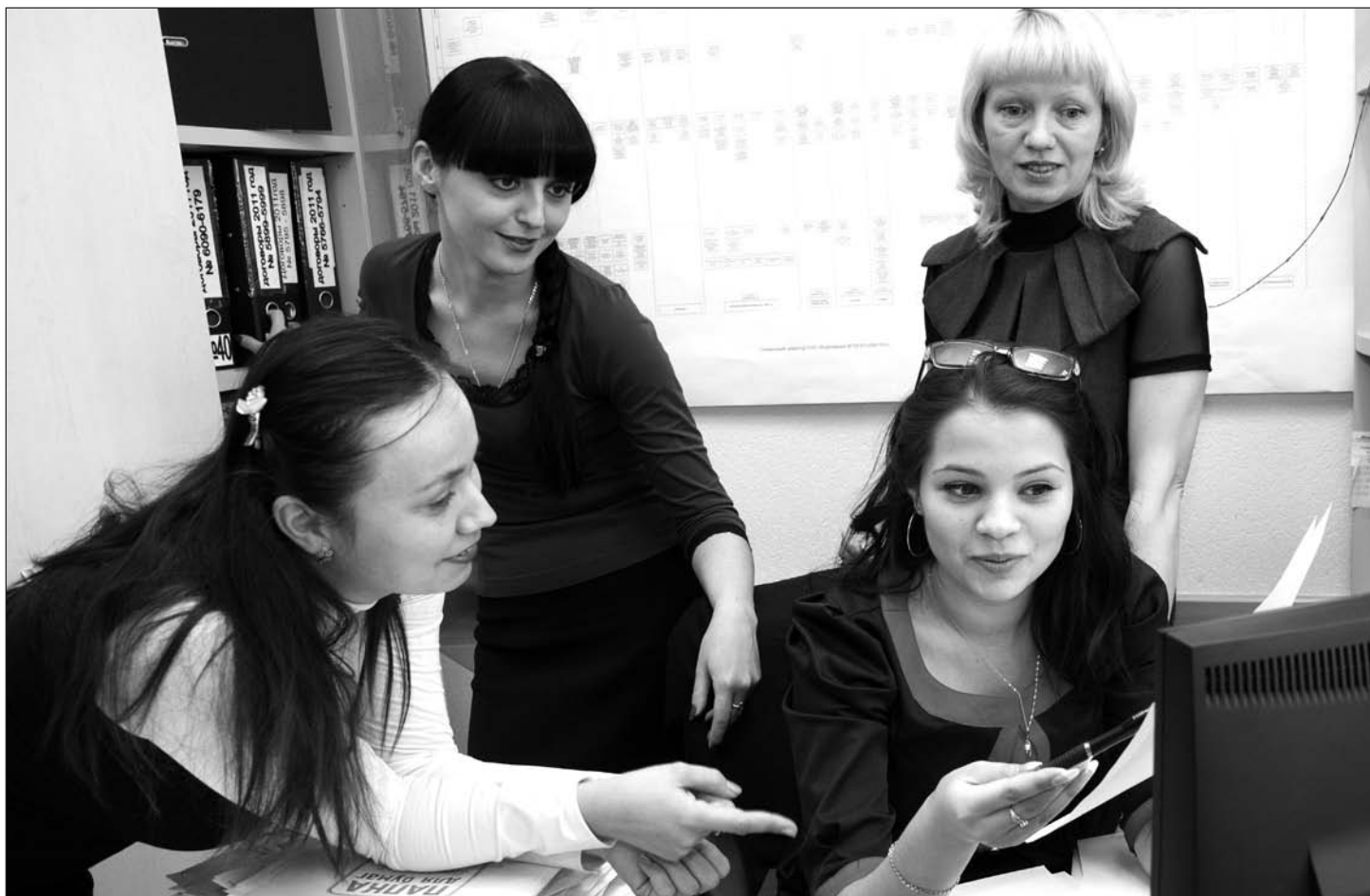
Решение юридических задач часто требует коллективного мозгового штурма

У каждой из сотрудниц этого отдела своя работа. Они ненадолго отрываю взгляд от монитора компьютера, чтобы ответить на телефонный звонок или проконсультировать вошедших в кабинет людей. И снова – внимание на компьютерный экран. А вокруг на полках стеллажей – огромное количество папок-регистраторов. Точно, как в архиве. Но нет, это рабочие документы, которые могут понадобиться в любую минуту, поэтому всегда должны быть под рукой.