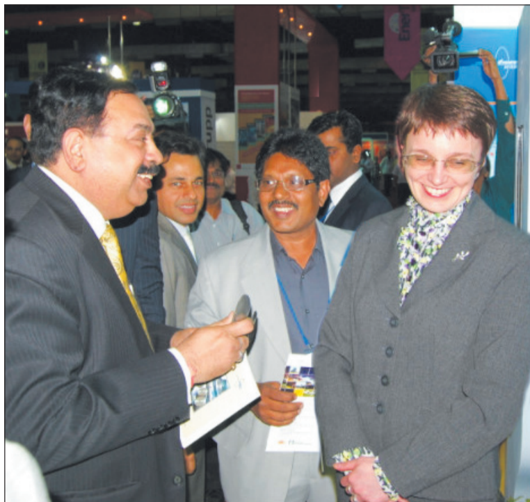
Комплимент от индийских коллег

Женщина-начальник – либо не женщина, либо не начальник. (мужской афоризм) Женщина-начальник – это больше, чем просто женщина. (женский афоризм)