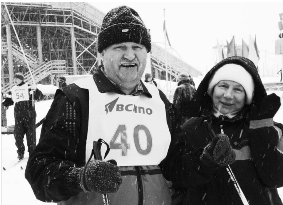
На лыжню – всей семьёй!