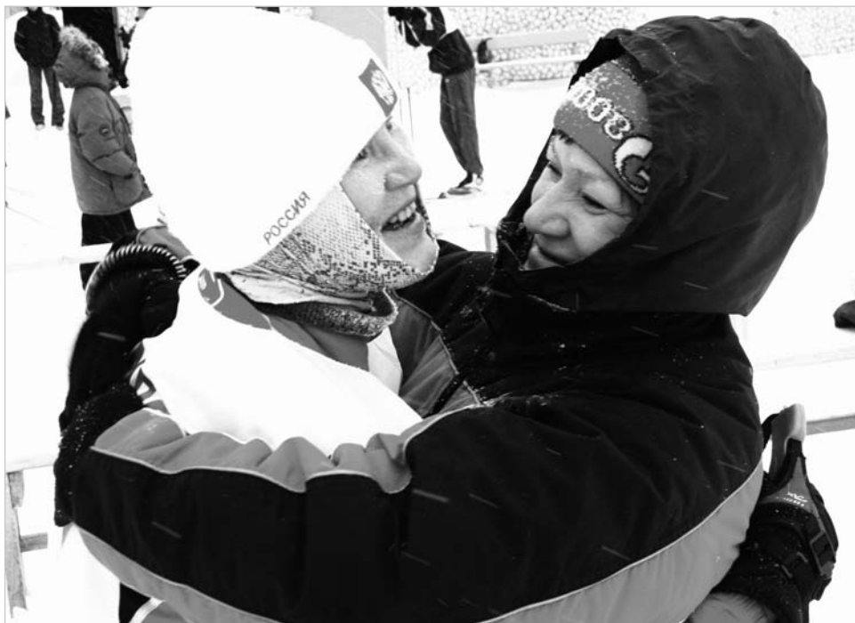
На лыжне – соперницы, в жизни – подруги