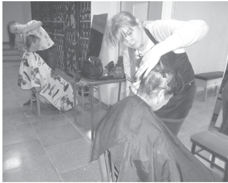
В рамках месячника, посвященного Дню пожилых людей, обучающиеся группы парикмахеров БПТ бесплатно подстригали пенсионеров.

Пожилые сельчане получили возможность пройти профилактические осмотры, не выезжая за пределы своей территории. Так, 20 сентября выездная бригада медиков побывала в Барабе . Прием граждан проводили терапевт, акушер-гинеколог, невролог. Жители села могли сдать кровь на анализ, измерить внутриглазное давление, сде-