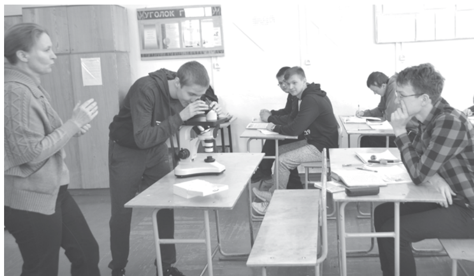
С помощью электронного микроскопа студенты изучают свойства металлов.