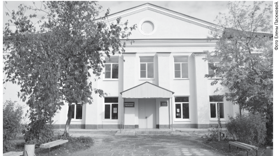
В прошлом году в Тыгишском ДК прошёл капитальный ремонт, после чего это учреждение культуры зажило новой жизнью.

– Да, несомненно, без финансов не будет ремонтов. Отмечу тот факт, что после того, как управление культуры стало автономным учреждением, мы можем принимать участие в конкурсах на денежные гранты, которые проводят министерства и ведомства культуры, в том числе и на проведение ремонтных работ. Как, например, в этом году городской округ Богданович выиграл грант на проведение ремонтных работ в Троицком СДК. Деньги на это будут выделены солидар-