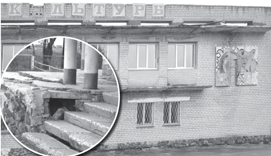
В скором времени Гарашкинский ДК ждёт ремонт.