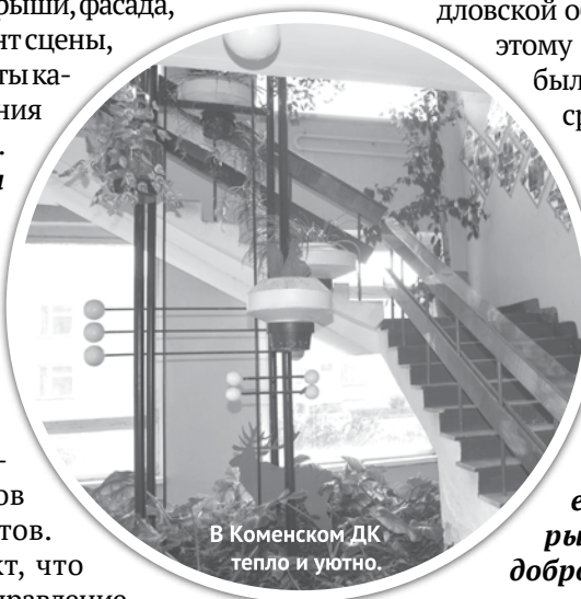
В Коменском ДК тепло и уютно.

В общем, управление культуры не оставляет без присмотра ни одно свое учреждение. Мы активно принимаем участие во всех конкурсах, ищем средства и на ремонты, и на приобретение необходимого оборудования. Делаем все возможное для того, чтобы посетители учреждений культуры чувствовали себя комфортно. Пробуем, решаем, осуществляем.