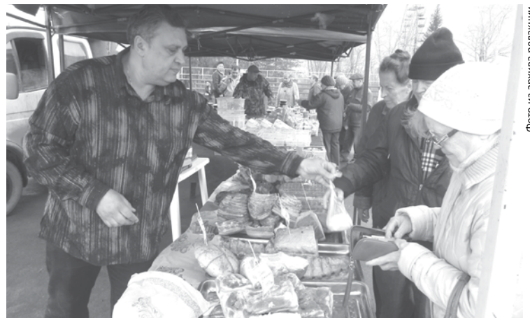
Сельскохозяйственные ярмарки всегда пользуются популярностью у богдановичцев, так как здесь они могут купить качественный товар из первых рук.