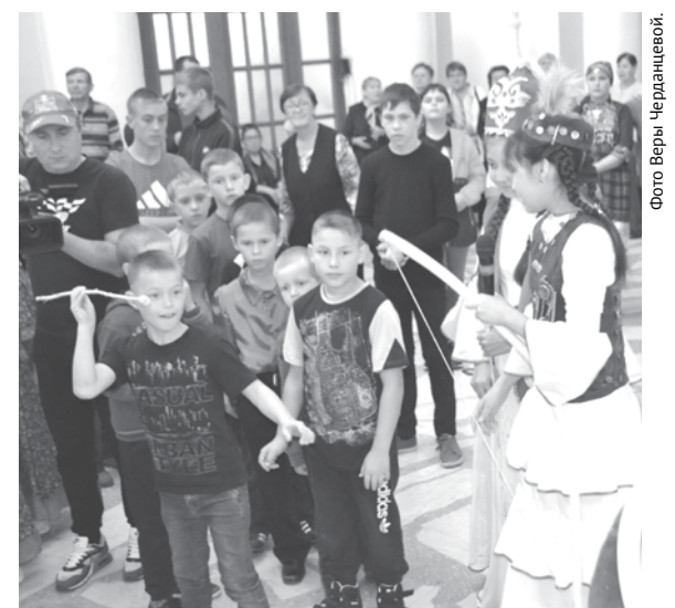
Для детей и взрослых в фойе были организованы игры и забавы, которыми в прошедшие века развлекались народы Урала.