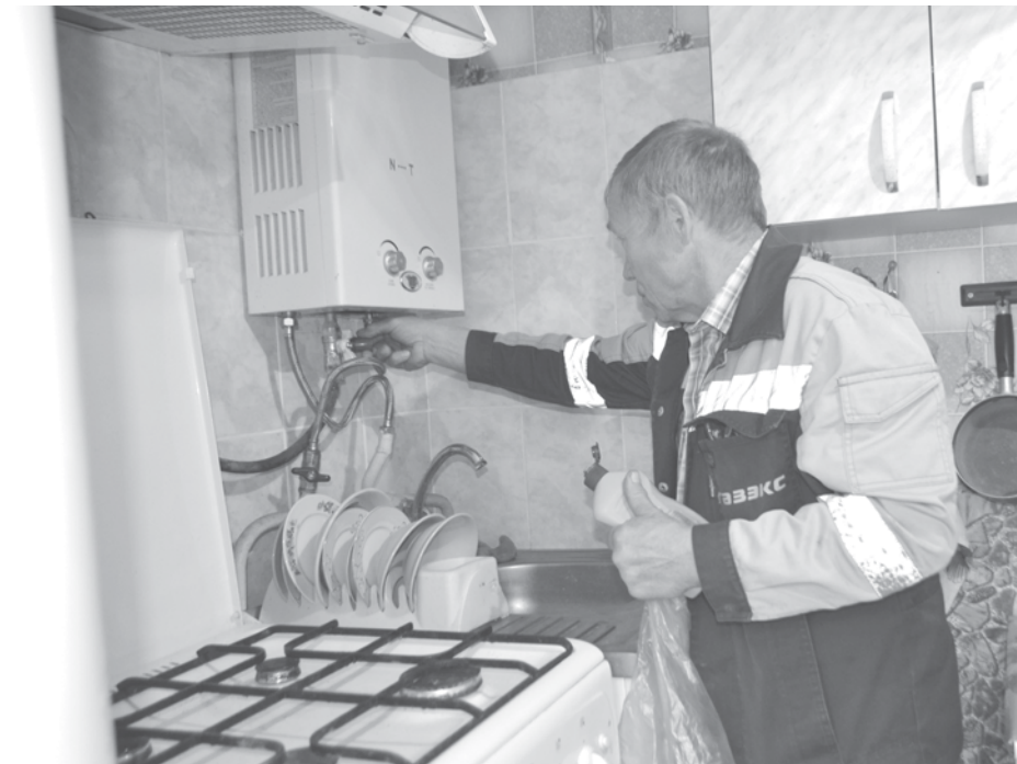
Слесарь проверяет кран водонагревателя на отсутствие утечки газа, промазывая его мыльным раствором.

От редакции: вынужденная мера, к которой прибегают газовщики, отключая весь подъезд из-за отсутствия хозяев хотя бы одной квартиры, вызывает недоумение. Ведь люди могут отсутствовать по разным причинам: быть в командировке, на лечении в стационаре, на отдыхе... Может быть, газовщикам стоит решение этой проблемы взять в свои руки и, например, хотя бы за месяц до проверки уведомить владельцев квартир о ней. Тогда, может быть, люди, уезжая в это время, будут оставлять ключи соседям.