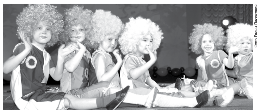
Маленькие циркачи из ДШИ порадовали зрителей весёлым номером.

В перерывах между номерами ведущие проводили розыгрыш сувениров среди зрителей. Не обошлось без шуток и смеха. Закончилось мероприятие красочным шоу мыльных пузырей, в котором приняли участие и маленькие зрители.