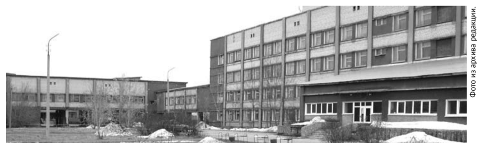
В планах на ближайшие пять лет богдановичской больнице предстоит провести реконструкцию.

– Как я уже сказала, один рентгеновский аппарат будет работать в хирургическом корпусе, где будет приёмный покой и детское отделение, а второй – в поликлиническом комплексе, в состав которого войдут две поликлиники – взрослая и детская. Детская поликлиника разместится на первом этаже