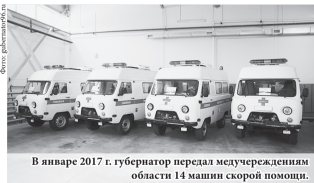
В январе 2017 г. губернатор передал медучреждениям области 14 машин скорой помощи.

В ближайшие годы предстоит решить проблему очередей в поликлиниках, обеспечить каждую больницу достаточным количеством «узких» специалистов. По словам губернатора, также нуж-