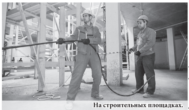
На строительных площадках.

Ещё одно направление работы правительства области – расселение ветхого и аварийного жилья. С 2013 года расселено более 12 тыс. человек. Ликвидировано 196 тыс. м 2 аварийного жилья. До 1 сентября 2017 года весь аварийный жилой фонд, признанный таковым по состоянию на 1 января 2012 года и входящий в реестр, должен быть полностью расселён.