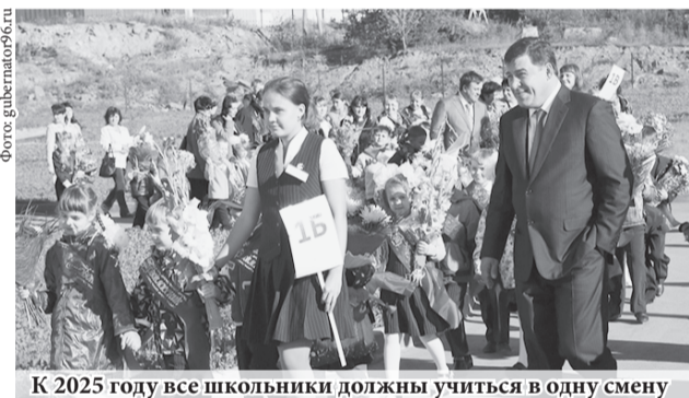
К 2025 году все школьники должны учиться в одну смену

В области начался перевод школ на односменный режим обучения. В 2016 году создано 3700 новых учебных мест, введена в строй первая очередь самой крупной и современной школы области в районе «Академический» (г. Екатеринбург).