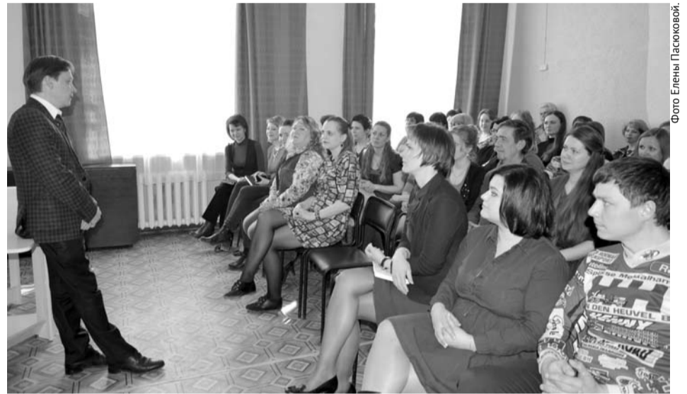
Встреча с работниками учреждений культуры проходила в теплой и непринужденной обстановке.