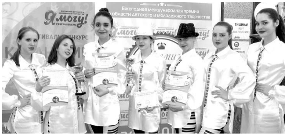
В очередной раз богдановичские артисты заявили о себе на международном уровне.

Членам жюри наш коллектив понравился. Было отмечено, что в отличие от многих, даже достаточно взрослых коллективов, дети из «Ассорти» поют многоголосие (даже самые маленькие) и при этом еще и много двигаются. Также члены жюри