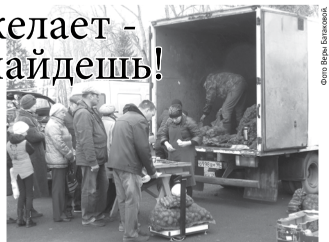
Самые длинные очереди были у прилавков с овощами и картофелем.

Большим спросом у горожан пользовалась мясная и рыбная продукция. На ярмарке было представлено разнообразие копченой и вяленой рыбы (горбуша, сельдь, кета и многое другое) из Асбеста и Артей. Большой выбор мясной продукции, как свежей, так и копченой, представили индивидуальные предприниматели из поселка Полдневого, сел Гарашкинского, Кунарского. В широком ассортименте была представлена молочная продукция, продукты пчеловодства, сладости. Продавались саженцы плодовых деревьев, кустарников, ягод и цветов, а также