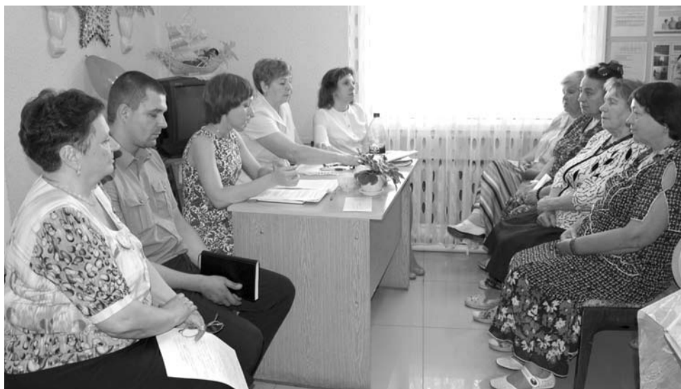
На расширенном заседании совета ветеранов и пенсионеров решались важные вопросы.

На встрече было задано много вопросов, ни один из которых не остался без ответа.