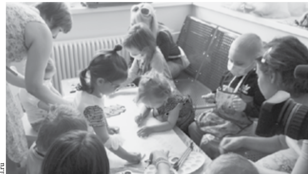
В центре детской онкологии и гематологии ОДКБ №1 в рамках проекта «Искусство против рака» прошло увлекательное занятие, это помогает отвлечь маленьких пациентов от больничных будней.

Первое в Екатеринбурге и восьмое в Свердловской области отделение паллиативной помощи открылось в ЦГБ № 2 имени Александра Миславского.