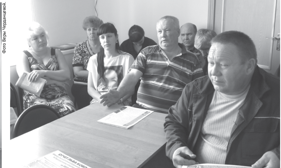
В «Богдановичском керамзите» депутату задали много вопросов.