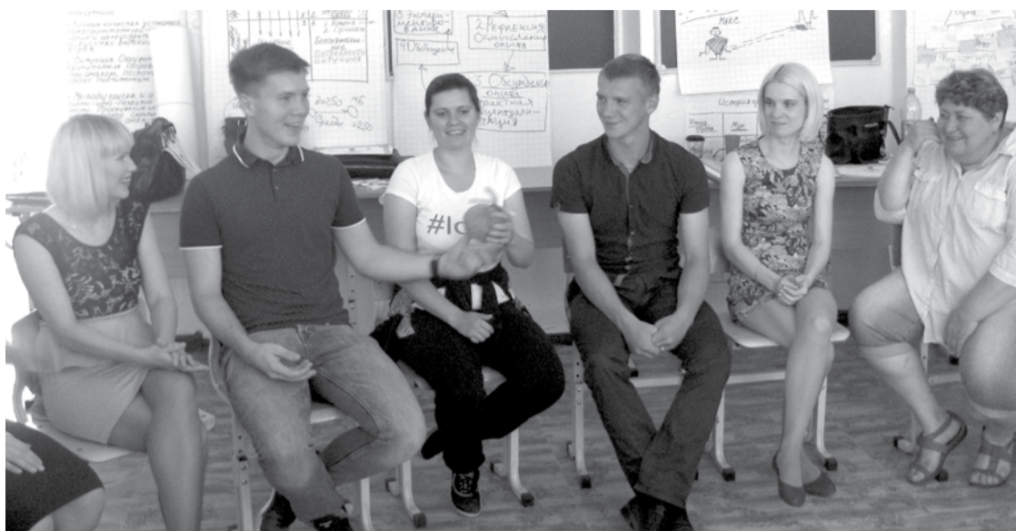
Занятия в игровой форме вызвали у начинающих предпринимателей множество положительных эмоций.