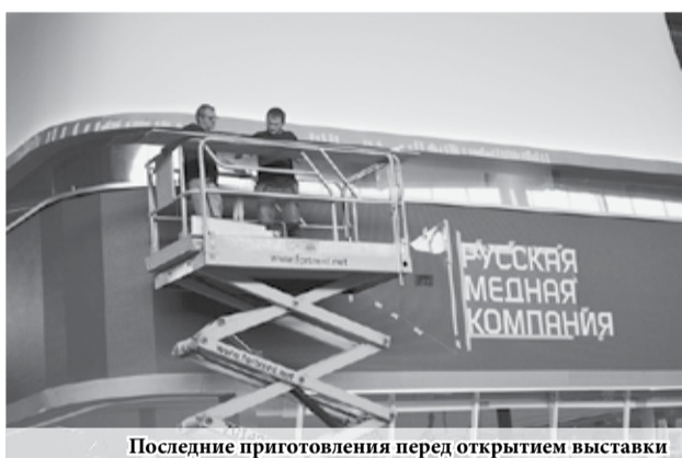
Последние приготовления перед открытием выставки