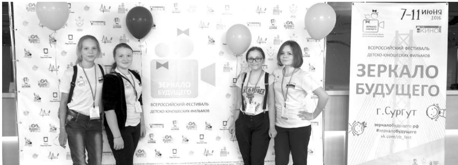
Богдановичские мультфильмы студии «Анимир» выехали за пределы города.

В честь открытия фестиваля для участников был организован концерт в местной филармонии. За время, проведённое здесь, дети многому научились, сняли свой