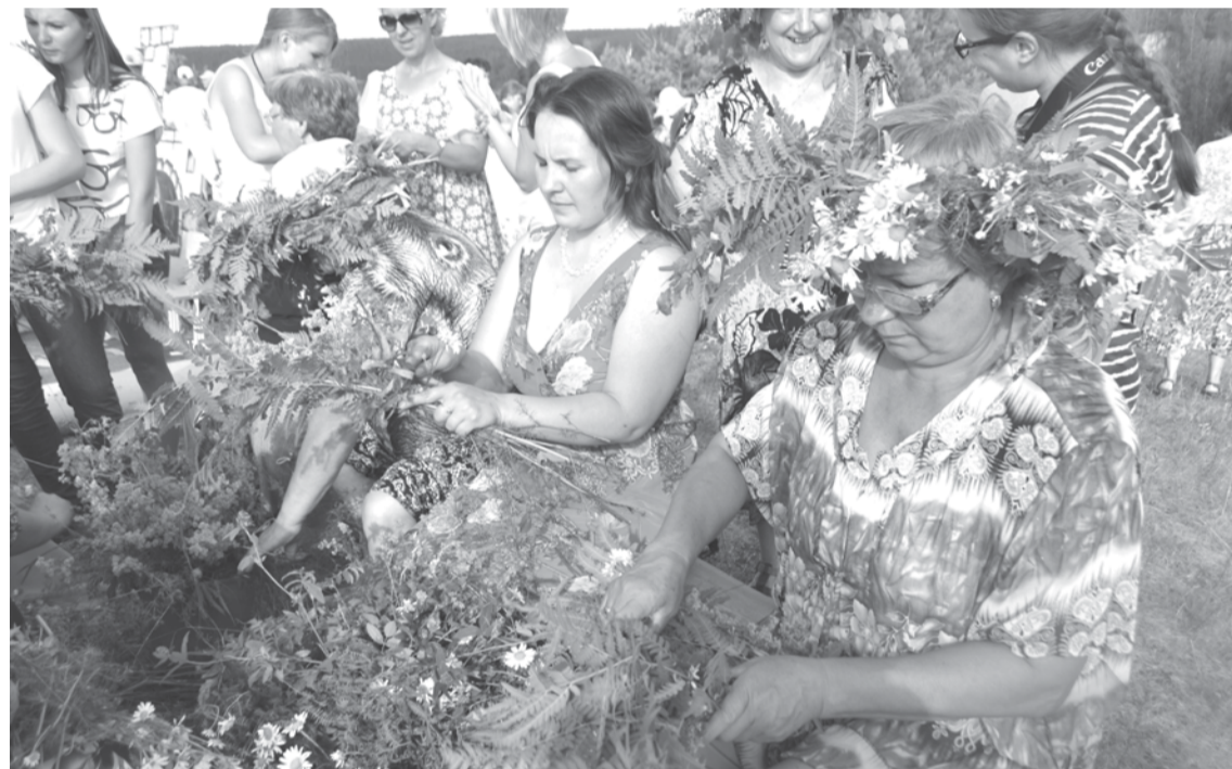
Мастер-класс по плетению венков привлёк к участию многих гостей праздника.