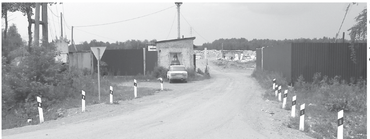
Все твердые бытовые отходы должны быть отправлены сюда - на Богдановичский лицензированный полигон.

Запрещается выбрасывать мусор, образовавшийся от ремонта помещений. Собственник помещений, где производились ремонтные работы, обязан вывозить мусор на городской полигон самостоятельно либо арендовать транспортные средства в специализированной организации. Особенно хочется предостеречь компании, занимающиеся заменой окон, дверей. На индивидуальных предпринимателей и юридических лиц за подобное деяние будут налагаться штрафы по первой части статьи 15 закона об административных правонарушениях. По этой статье размер штрафа может составлять на должностных лиц - от 10 до 30 тысяч рублей; на юридических лиц - от 100 тысяч до одного миллиона.