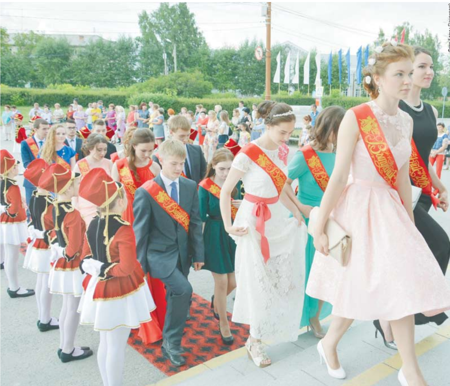
По красной дорожке выпускники смело шагают навстречу новой жизни.