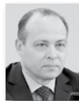
Сергей Пересторонин, министр промышленности и науки Свердловской области:

В рамках этой госпрограммы развития промышленности предприятиям выделяются специальные субсидии. Создаются новые для региона направления промышленности – например, авиационное».