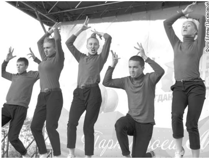
Выступление коллектива «Red Rabbits» было, как всегда, зажигательным.