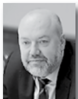
Павел Крашенинников, председатель комитета Госдумы РФ по гражданскому, уголовному, арбитражному и процессуальному законодательству:

Государственные программы поддержки, направленные на сокращение налоговых платежей или даже их временную отмену, снижение административных барьеров, информационную поддержку, создание особых экономических зон и другие меры приносят свои плоды. Предпринимателей становится все больше, все больше людей выбирают бизнес в качестве основного занятия. Это можно, без сомнения, назвать позитивной тенденцией в развитии отечественной экономики».