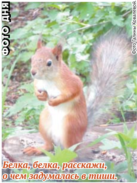
Белка, белка, расскажи, о чем задумалась в тиши.