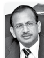
Рамеш Абхишек, заместитель министра торговли и промышленности Индии:

«В первую очередь, мы хотим представить народу России новые знания Индии в технической сфере. Мы хотим показать россиянам, что Индия меняется, что сегодня – это современная промышленная экономика».