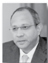
Панкаджем Сараном, посол Индии в Российской Федерации:

«Свердловская область рассчитывает на то, что партнерство Индии в выставке ИННОПРОМ-2016 позволит индийским коллегам по достоинству оценить имеющийся промышленный и культурный потенциал Свердловской области, станет новым этапом в развитии деловых, культурных и дружественных связей».