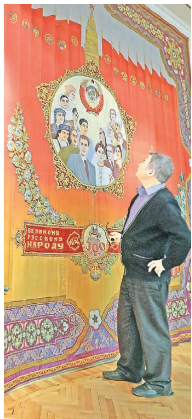
Монументальный ковер ручной работы — свидетельство исключительного трудолюбия узбекских вышивальщиц.

— Спасибо за выставку, — читаем первый отзыв посетителей выставки «История России XX века в подарках». — Она показывает мастерство наших предков, их любовь и чужа, достойные уважения».