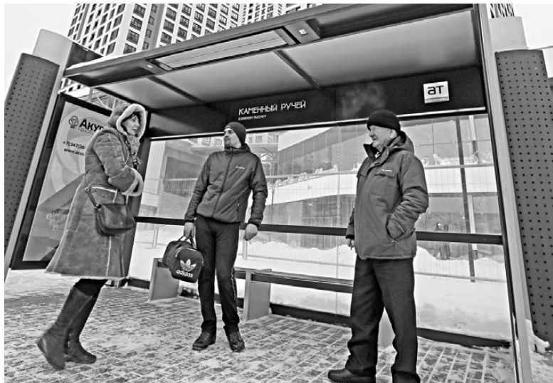
Остановочный комплекс выглядит красиво, но пассажиры особого тепла не ощущают.