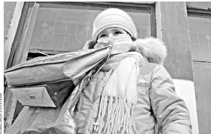
Врачи считают, что медицинская маска может остановить распространение инфекции.