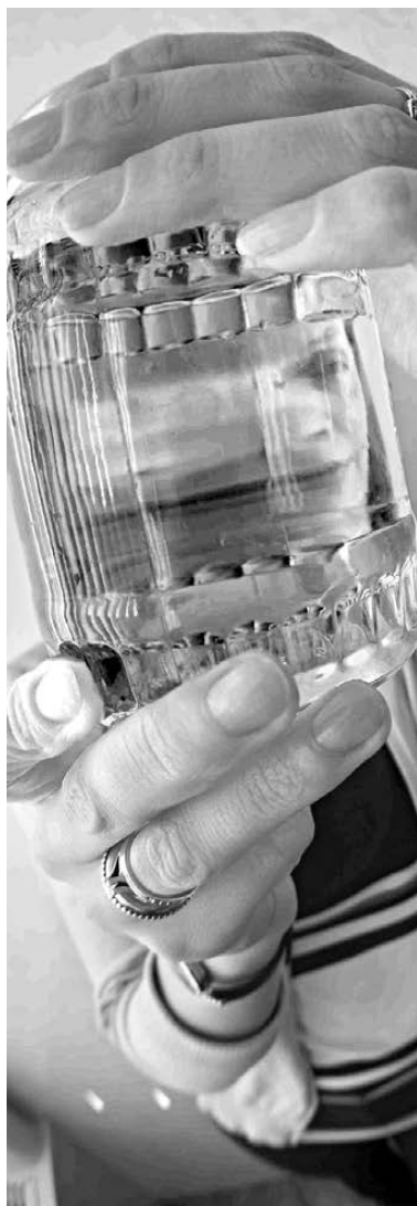
Уральцы уже с подозрением относятся к любой питьевой воде: мало ли кого в ней можно найти.

После того как фото и видео обитателей водопровода заполнили