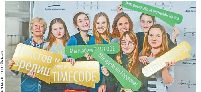
ОФ КОМИТЕТ «ТАЙМКОД»

За пять лет «Таймкод» стал путевкой в журналистику для тысяч школьников и студентов.