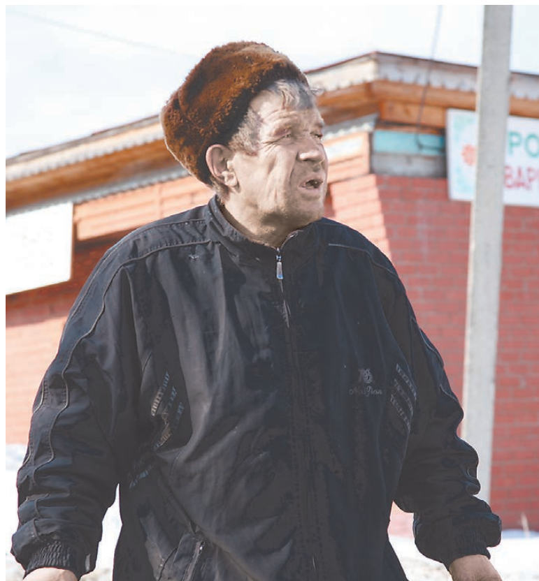
Пьяный в деревне — обычная картина.

Большое дело, по ее словам, сделал запрет на продажу алкоголя в ночное время. Продавцы не рискну-