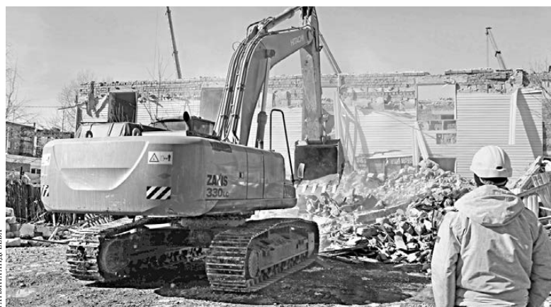
В Екатеринбурге уже снесли 36 домов, построенных на землях ИЖС.

Законопроект ещё находится на стадии обсуждения. Он уже в основном поддержан в министерстве строительства региона. Определены и основные условия участия в программе: рассчитывать на бесплатную квартиру смогут только владельцы жилья, чьи квартиры уже снесены, и получают они ровно столько квадратных метров, сколько потеряли.