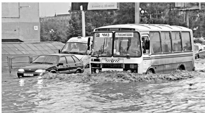
Дороги Челябинска в одночасье превратились в бурлящие реки.