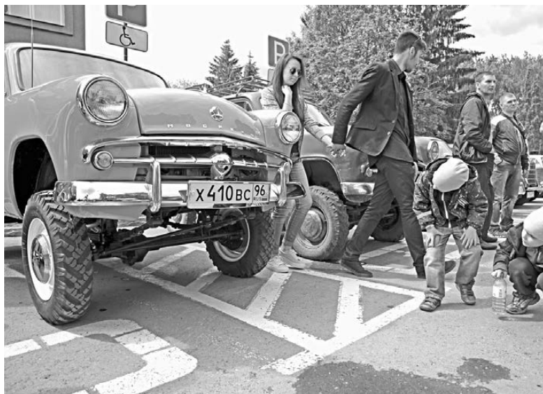
Полноприводный «Москвич-410Н» повышенной проходимости по достоинству оценили в конце 50-х годов на целине.

Захватывающую историю можно рассказать о каждом экспонате. Чего стоит, например, трофейный Opel Kadett 1936 года, на котором, как утверждают хозяева, в 1944 году прямо с фронта вернулся домой, на Урал, некий советский разведчик.