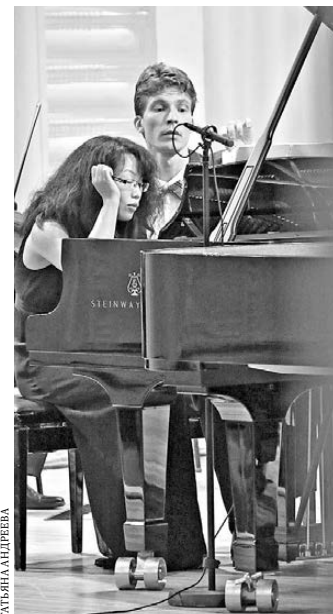
Игра в четыре руки понравилась и музыкантам, и зрителям.