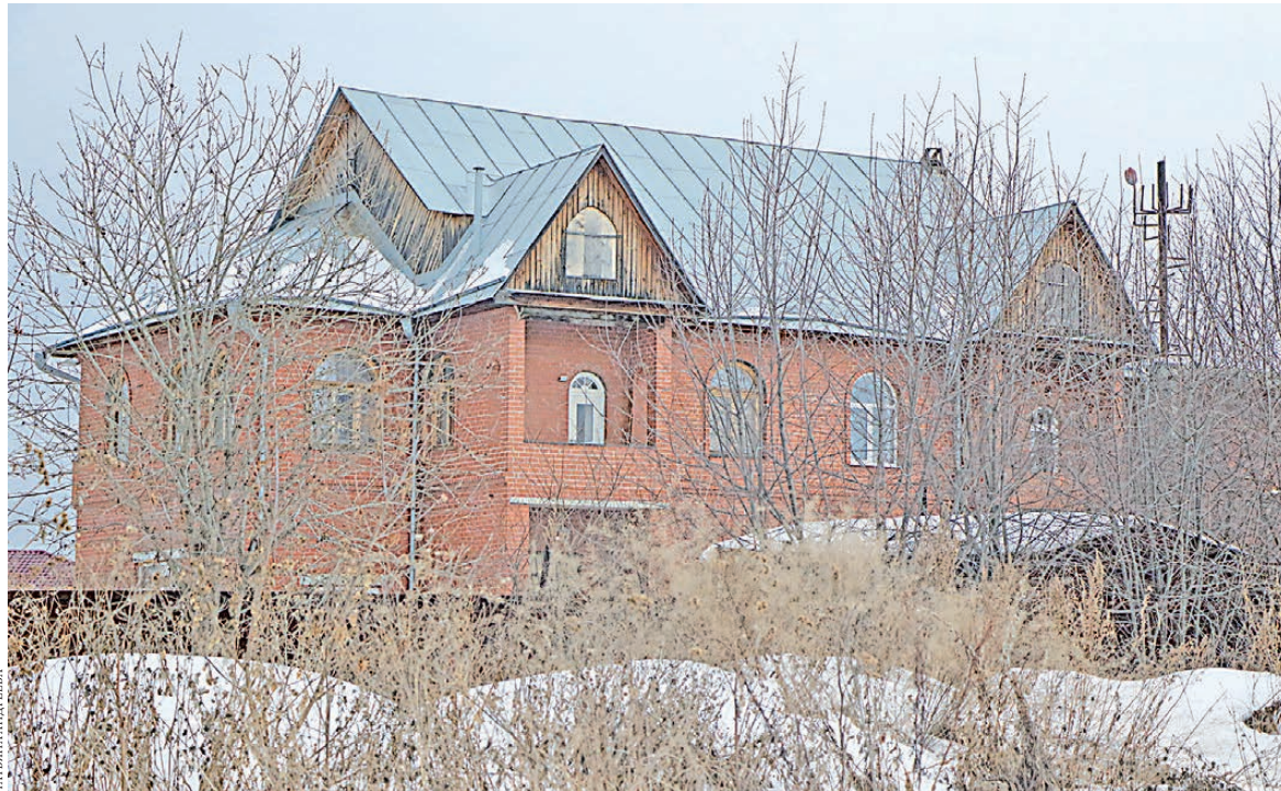
Особняк именитого юриста расположен в престижном загородном поселке.

Практика «увода» имущества из поля зрения судебных приставов с начала лихих девяностых в России очень распространена. Должники оформляют все, что имеет ценность: дома, машины, гаражи, — на ближайших родственников и предстают перед законом в чем мать родила. При этом нарушителями закона как бы и не являются: не отказываются исполнять наложенные судом обязательства, клянутся отдать все до копейки по мере своих скромных сил и средств. Вот только исполнение растягивается на десятилетия.