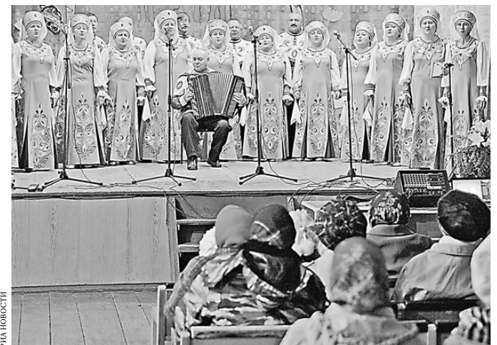
Власти обещают, что модульные ДК появятся прежде всего в тех деревнях, где кипит культурная жизнь.

Для нестандартного ценного багажа покупают отдельный билет. В том, что лик хранителя земли русской — истинная ценность, монахи не сомневались