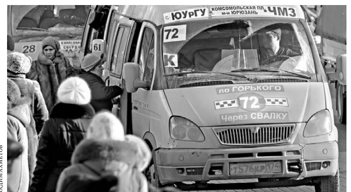
Челябинцы считают, что властям лучше взяться за автоперевозчиков, а не выкручивать руки пассажирам, требуя предъявить проездной билет.