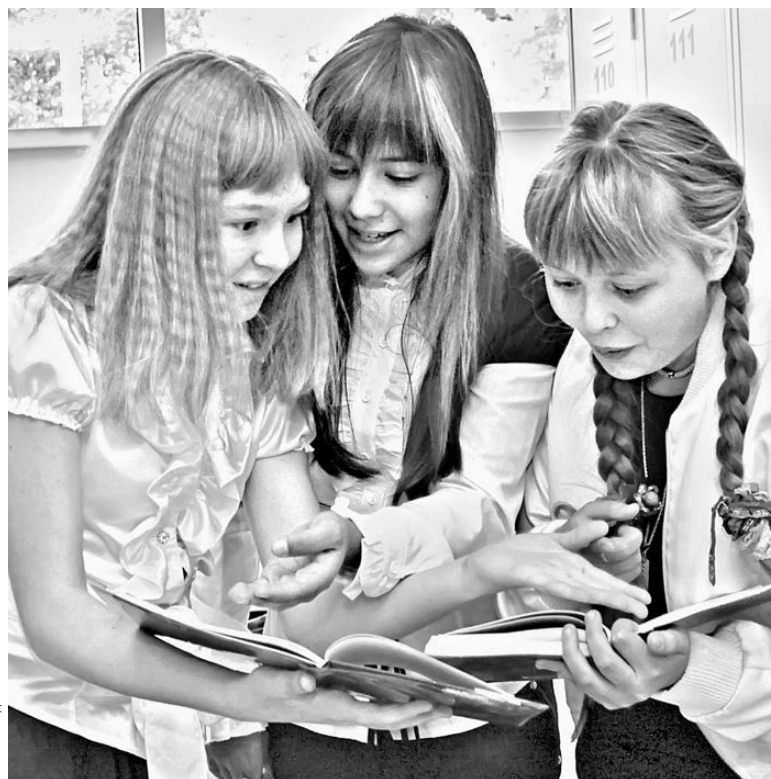
По мнению библиотечкарей, дети не утратили интерес к книге.