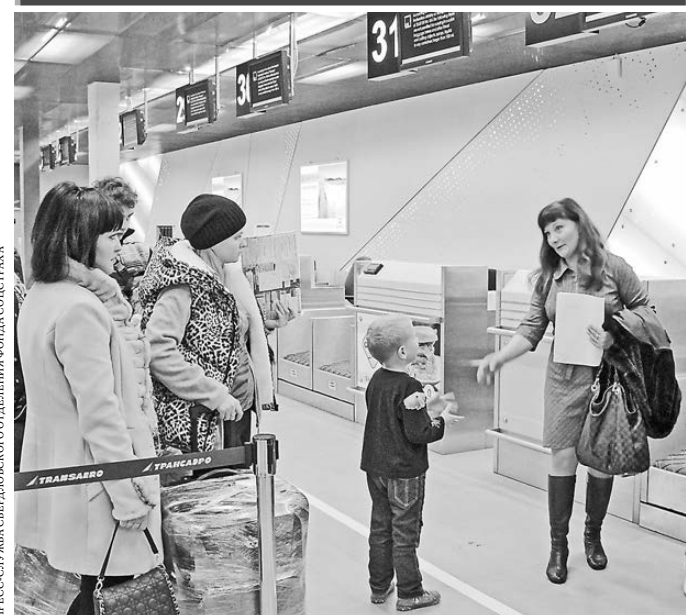
ПРЕСС-СЛУЖБА СВЕРДЛОВСКОГО ОТДЕЛЕНИЯ ФОНДА СОЦИАЛЬНОГО СТРАХОВАНИЯ

29 октября Свердловское региональное отделение Фонда социального страхования РФ отправило первую группу детей-инвалидов в санатории Крыма. Для юных пассажиров были созданы максимально комфортные условия, начиная от приезда в аэропорт и заканчивая посадкой в самолет. До конца года за счет средств соцстраха в Крыму смогут оздоровиться более 5,6 тысячи жителей Свердловской области.