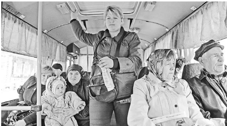
Льготники Екатеринбурга могут быть спокойны: для них стоимость проезда пока осталась прежней.

О намерении поднять цену проездных и разовых билетов для пен-