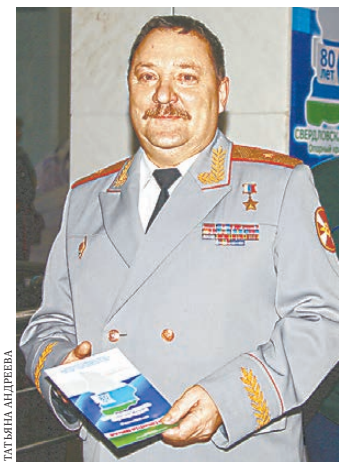
Генерал-майор Роман Шадрин возглавил объединение уральцев-героев.