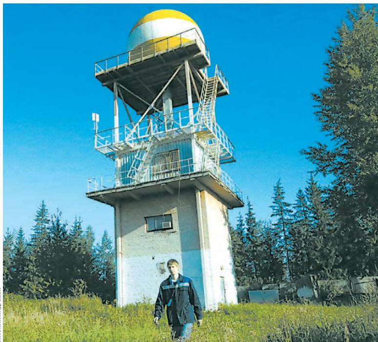
Единственный на весь Урал метеолокатор установлен на территории аэропорта Кольцово, под Екатеринбургом.