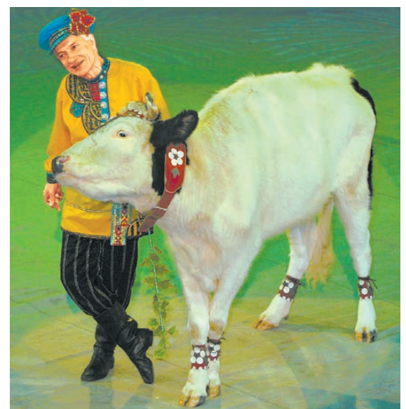
На арене цирка буренки исполняют народные танцы.