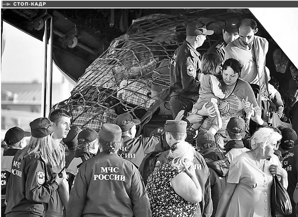
В Екатеринбург на самолете МЧС прилетели 112 вынужденных переселенцев с юго-востока Украины, среди них 33 ребенка, самому младшему из которых 11 месяцев. Еще около 40 человек доставили на Средний Урал поезда из Адлера и Анапы. Беженцы, прибывшие спецбортом МЧС, отправились в пункты временного размещения в Нижнем Тагиле, остальные — в Первоуральск и Березовский. По данным на 29 июля, власти Свердловской области помогли обустроиться в регионе 180 украинским беженцам.

В БЭБИ-БОКСЕ, установленном весной этого года в одном из храмов в центре Екатеринбурга, впервые сработала сигнализация, извещающая, что в «колыбель» положили ребенка. Сотрудники храма по инструкции вызвали скорую и полицию. Медики, осмотревшие малыша, сказали, что он здоров, на первый взгляд, ребенку 3—5 дней. Рыжеволосый мальчик был в памперсе, тепло одет и закутан в плед. Никаких записок при подкидыше не было.