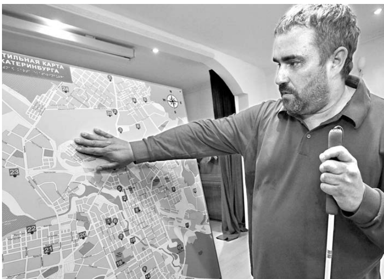
Названия улиц на карте легко читаются на ощупь, поскольку выполнены объемными буквами.

После успешной презентации областные власти выразили желание материально поддержать проект. По прогнозам общественников, к началу следующего года карты появятся на улицах и в общественных местах Екатеринбурга.