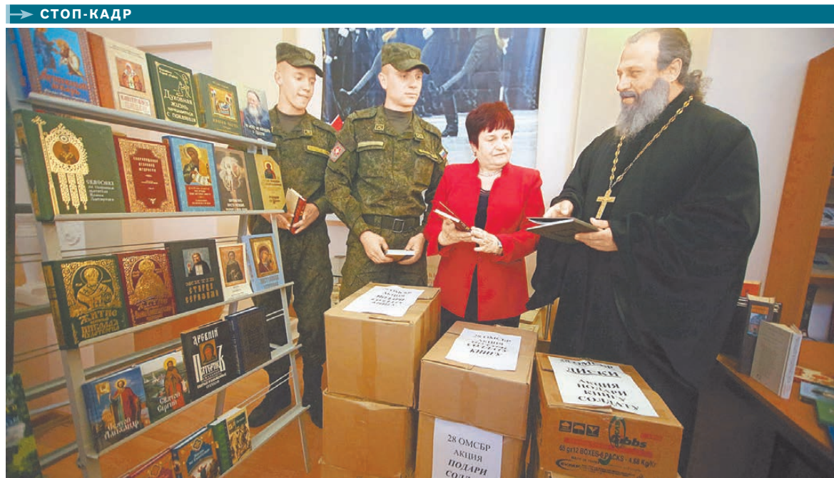
В 140 православных храмах Среднего Урала прошла акция «Подари солдату книгу». За месяц прихожане собрали более четырех тысяч книг для военнослужащих соединений, дислоцированных на территории Свердловской области. Книги передадут в моленные комнаты и храмы при воинских частях, а также в библиотеку окружного Дома офицеров.

В КУРГАНЕ своеобразно отметили Всероссийский день семьи, любви и верности, который отмечается 8 июля. В этот православный праздник работники городского загса провели акцию «8 июля—день без разводов»: решившимся развестись курганцам они предлагали отложить принятие решения по столь непростому вопросу. Напомним, 8 июля в России вспоминают святых Петра и Февронию, жизнь которых является примером любви и верности.