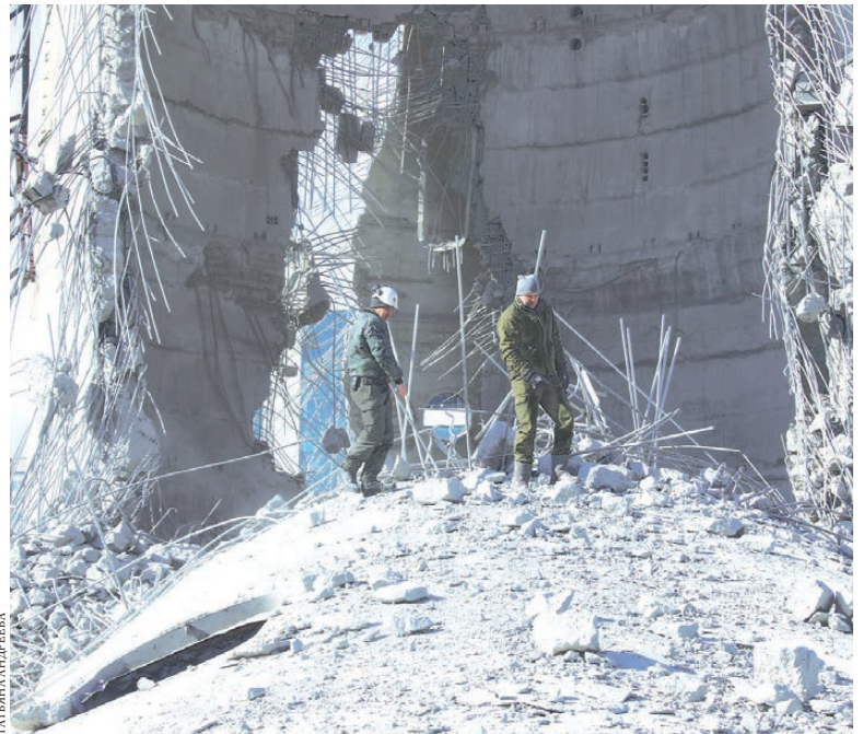
Фотокорреспонденту «РГ» одной из немногих удалось попасть внутрь разрушенной башни.