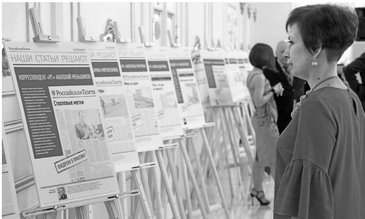
Гости вечера познакомились с публикациями журналистов «РГ», которые помогли отстоять веру людей в справедливость.