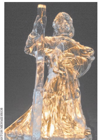
Авторы изваяния князя Владимира призвали земляков беречь ледяную скульптуру.