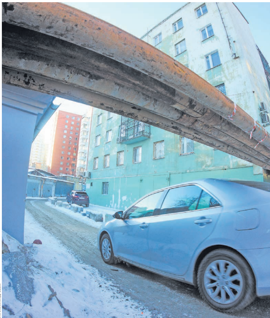
К дому № 15 на улице Вайнера ведет узкая дорога под трубой теплотрассы.

Но если исследование плит может только сдвинуть сроки, то жители дома № 15 на улице Вайнера, кажется, готовы уже пойти на баррикады, чтобы не допустить возведения под своими окнами основного здания центра. О несогласии с проектом они буквально кричат уже несколько лет, но безрезультатно. На днях жильцы отправили очередное возмущенное письмо в мэрию Екатеринбурга. Но на конструктивный ответ, признаются, уже не надеются, поэтому обратились в «РГ». Мы приводим доводы обеих сторон. Это не первый и не последний конфликт между горожанами, отстаивающими право на нормальную жизнь, и чиновниками, утверждающими, что во главу угла надо ставить не личные, а общественные интересы.