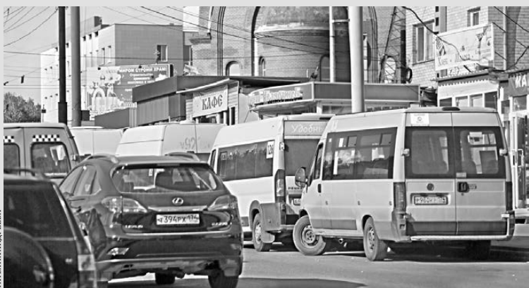
Новые правила должны увеличить пропускную способность перекрестков.