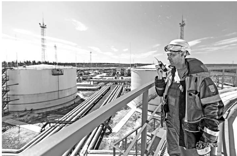
ОТДЕЛ ПО ЗАЩИТЕ ИНТЕРЕСОВ СО СМ И ПО ИСПОЛНЕНИЮ ОБЯЗАННОСТЕЙ ООО «РН-УВАТНЕФТЕГАЗ»

В сибирской тайге создан настоящий промышленный узел со станцией перекачки нефти, установкой по ее подготовке и узлом коммерческого учета.