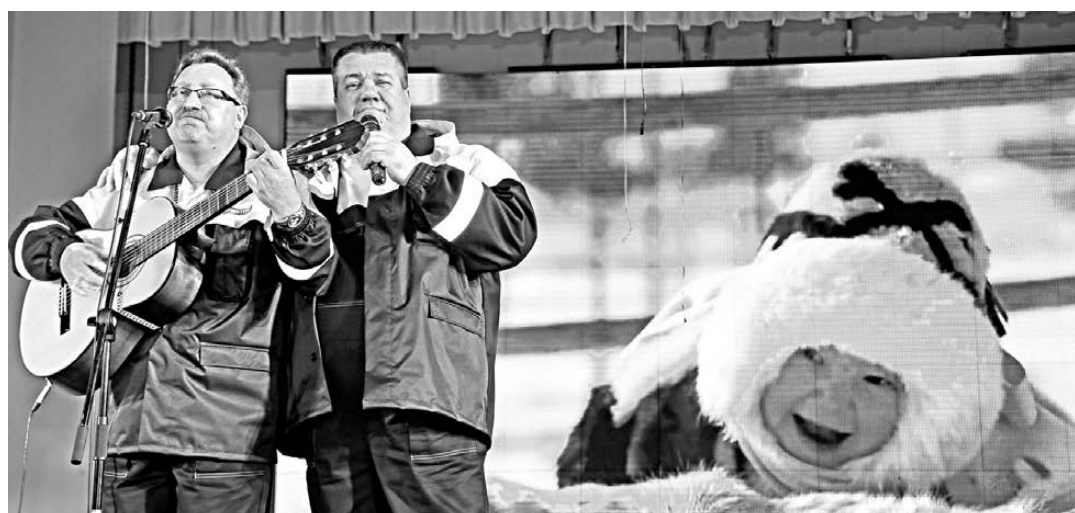
Дуэт из Сургута «Игорь-Михалыч» покорила зрителей задушевым и искренним исполнением.