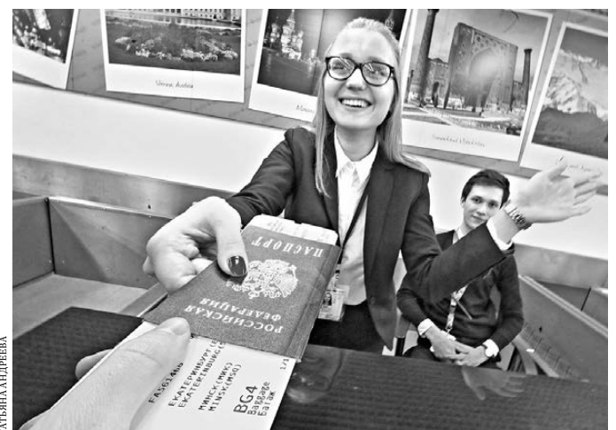
Минск — новое направление екатеринбургского авиаузла.