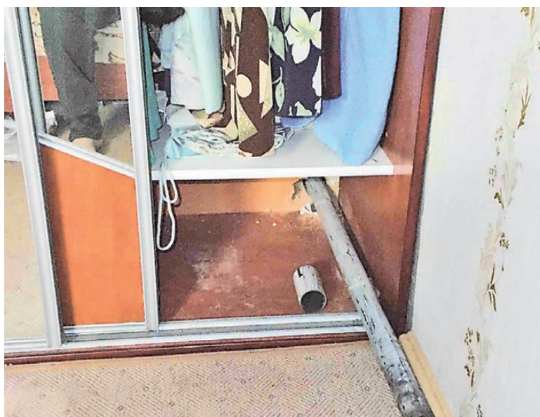
Рабочие протянули трубу отопления через встроенный в стену шкаф-купе.

вать полы никто не захотел, — объяснила Калинина.