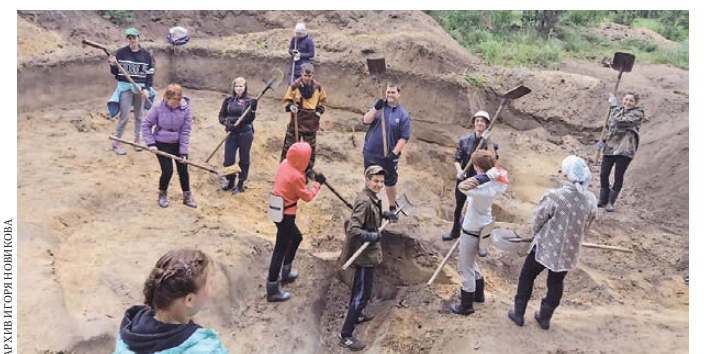
Раскопки шли в Каргапольском районе близ деревни Ташково.