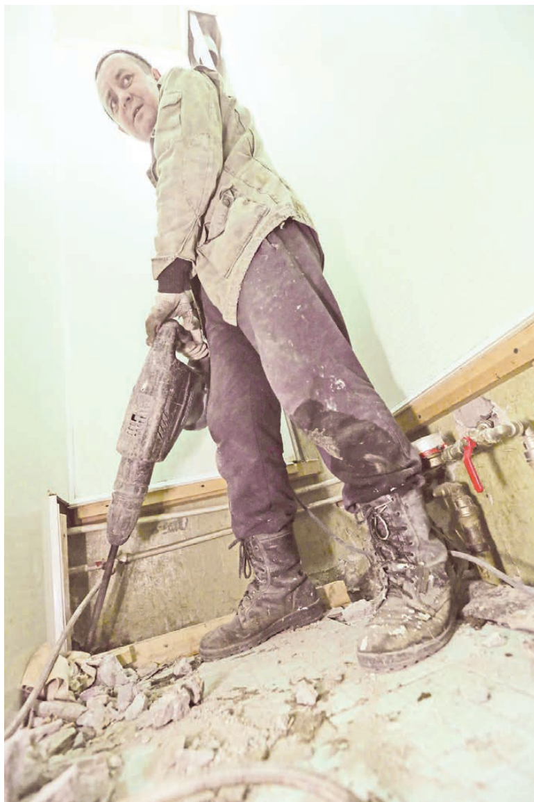
По закону собственник обязан обеспечить доступ к стенам.

— По закону, подрядчик не заходит в дом, если больше половины собственников отказываются от ремонта. Здесь вышло меньше. Мы боялись переходить на отопительный сезон со старыми трубами, потому что в любой момент они могли лопнуть. Такой случай уже был в прошлом году. Поэтому уговорили людей на другую схему отопления — «ленинградку» — и поспешили положить новые трубы. Понятно, вскры-