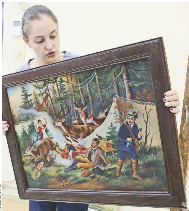
Дух народных сказаний живет на полотнах уральского самородка.