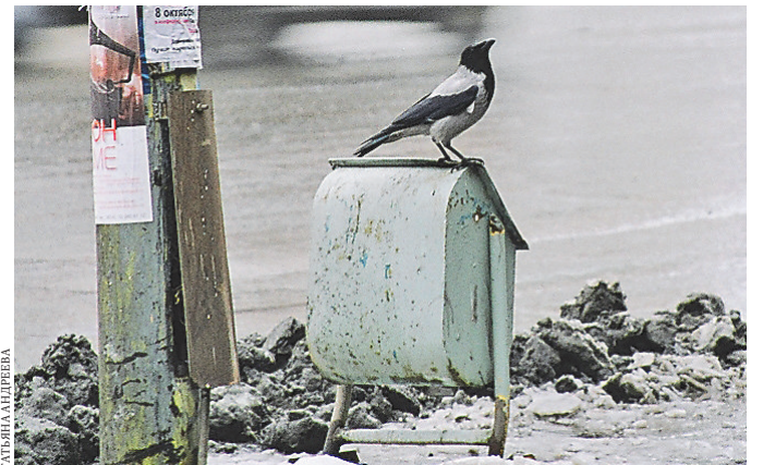
По мнению орнитологов, вороны очень умны, они знают, что делают.