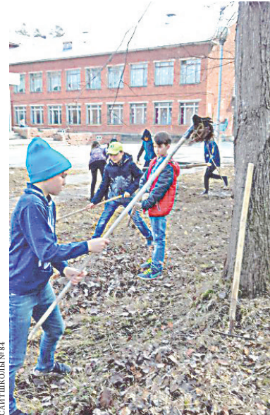
Школа построена в 60-х годах прошлого века.