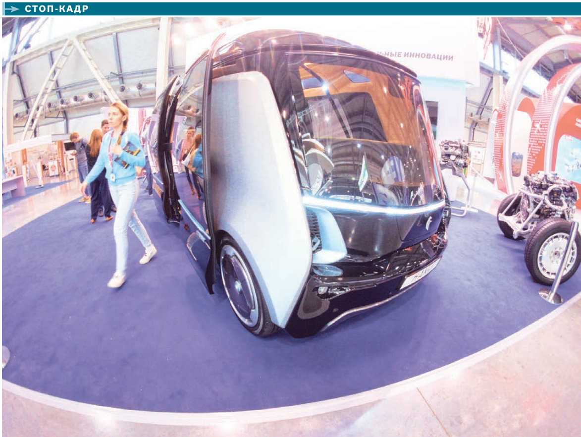
Одним из наиболее популярных экспонатов проходящей в Екатеринбурге выставки «Иннопром» стал прототип беспилотного электрического микроавтобуса. Разработка КамАЗа, Яндекса и Центрального научно-исследовательского автомобильного и автомоторного института не имеет руля. Все, что необходимо аппарату для перевозки пассажиров, — компьютерная программа и дорожная разметка. Производители рассчитывают опробовать автобус буквально через год: на чемпионате мира по футболу в России.

ДВЕСТИ миллионов рублей из тюменской казны направит на ремонт и восстановление приемного отделения и стационара поликлиники в Ялуторовске, а также на ремонт двух отделений и пищеблока, модернизацию стоматологического отделения и хирургического корпуса больницы в Заводоуковске. По словам губернатора Тюменской области, ремонт рассчитан на два года, строительные работы будут проводить поэтапно.