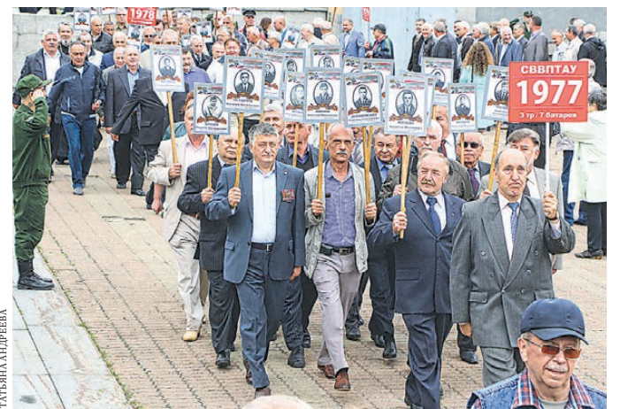
Многие офицеры СВВПТАУ погибли в горячих точках.