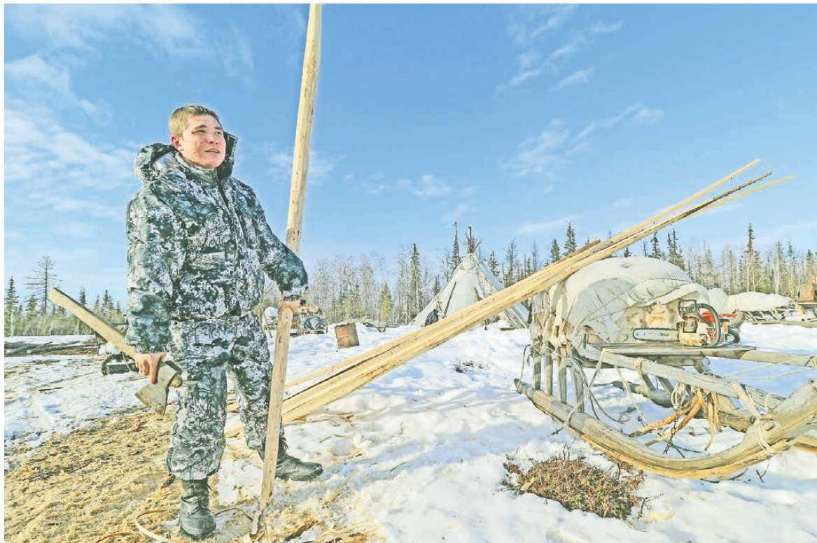
Чем ближе человек к природе, тем лучше сохраняются основы родной культуры и языка.

Удастся ли коренным народам Севера сохранить национальную самобытность под натиском цивилизации