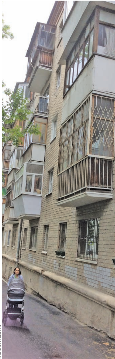
Жильцам этого дома на улице Фурманова придется затопорпиться, чтобы попытаться узаконить остекление балконов.

— Пока администрация не начала, условно говоря, нападать, собственникам нужно узаконить конструкции. Если балкон остеклен, но при этом не затеняет соседское окно, есть шанс получить разрешение. В любом случае предписание провести демонтаж должно исходить от суда.