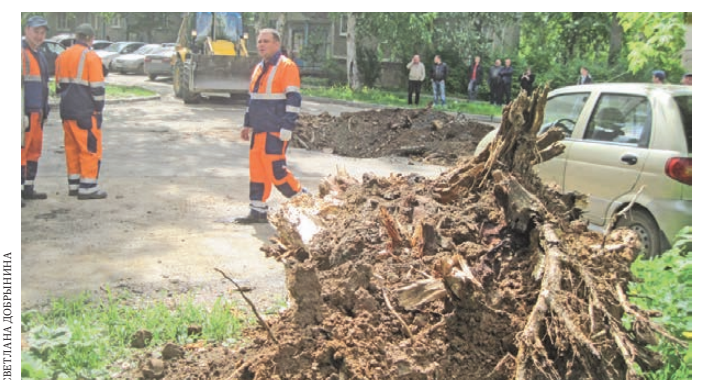
«Звезду эфира» все-таки выкорчевали и свалили на газон.