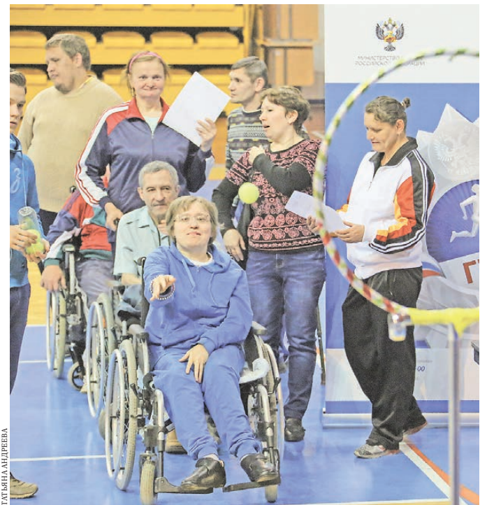
В Екатеринбурге прошел день апробации механизмов внедрения Всероссийского физкультурно-спортивного комплекса «Готов к труду и обороне» (ГТО) для инвалидов. В центре города была создана полоса испытаний для четырех категорий людей с ограничением по здоровью — с поражением опорно-двигательного аппарата, глухих, слепых и с нарушением интеллектуального развития.