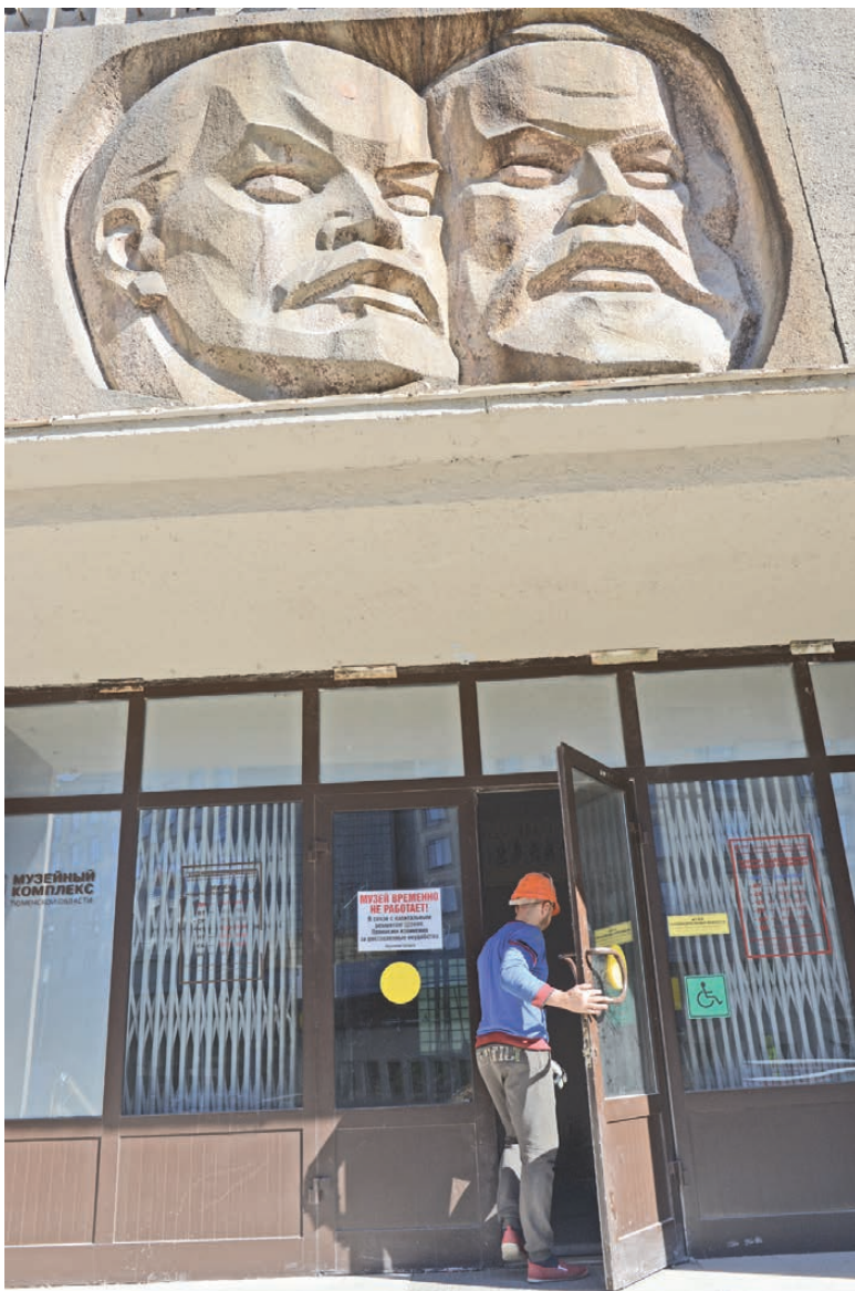
В ТМИИ, бывший Дом политпросвещения, теперь вход не воспрещен только строителям.

Зачем в Тюменской области создают музейное объединение-гигант