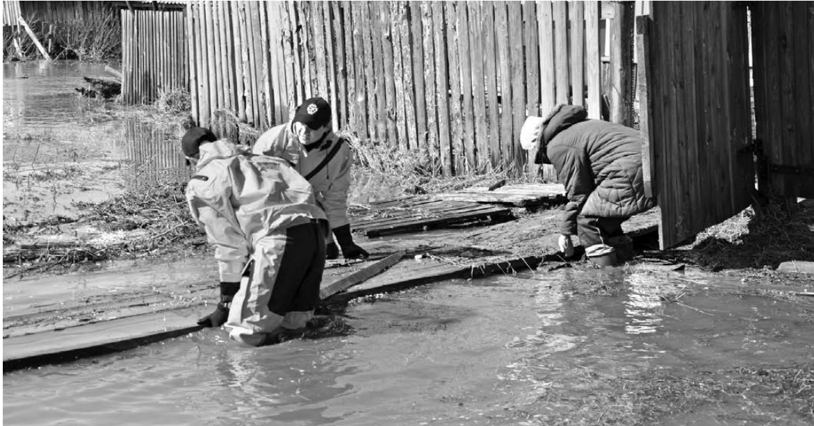
ГУ МЧС РОССИИ ПО СВЕРДЛОВСКОЙ ОБЛАСТИ

Из-за паводка на Среднем Урале эвакуируют жителей деревень