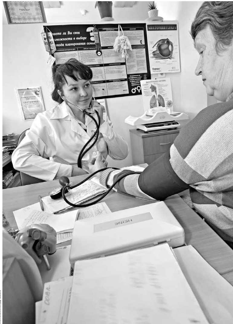
Жители села очень ценят возможность в любой момент посетить врача, даже если все специалисты принимают в одном кабинете.

Из красноуфимского села Русская Тавра омбудсмену прислали