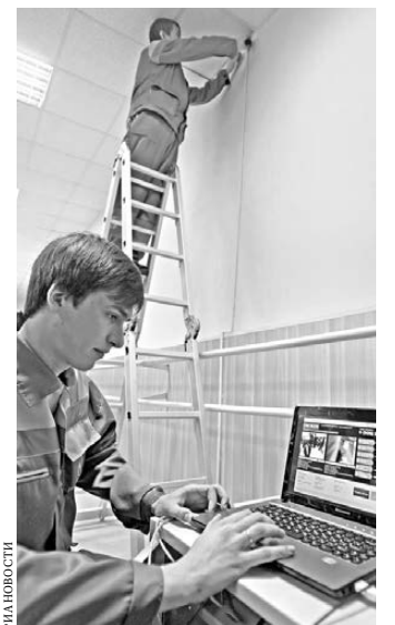
Запись с половины установленных в школах камер будет транслироваться на специальном сайте.